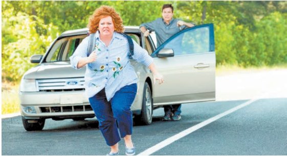
«ТАЙНА КОКО», 2017 (12+), 105 МИН.

Фильм позволяет расслабиться и втянуться в смешной сюжет, также он напоминает об элементарных правилах безопасности в финансовой сфере.