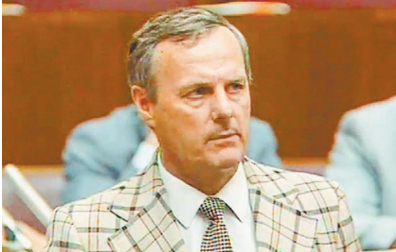
«ДЕЛО СОБЧАКА», 2018 (12+), 117 МИН.

Как выйти "из князи – в грязи" и обратно. У боксера Билли Хоупа все было прекрасно: звание чемпиона, красавица-жена и любимая дочка. Но фортуна отворачивается от него: при трагических обстоятельствах погибает любимая жена, дисквалификация на ринге, нулевые доходы, суд лишает его родительских прав... Хоуп должен отстоять звание чемпиона и вернуть дочь. Есть ли у него шансы на победу? Все решит его знаменитый хук левой... Типичный сценарий о бойце, чья жизнь напрямую зависит от спорта, настойчивости и силы воли. Сюжет затягивает, смотреть интересно.