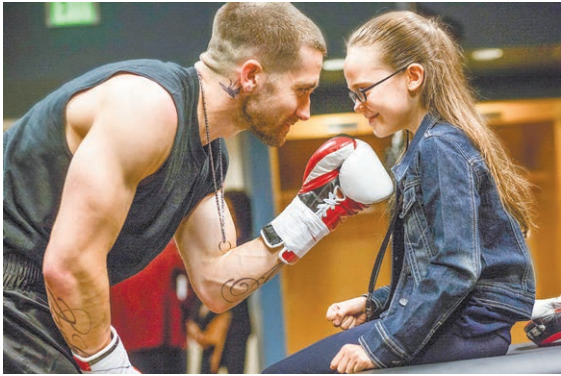
«ЛЕВША», 2015 (16+), 124 МИН.

Как выйти "из князи – в грязи" и обратно. У боксера Билли Хоупа все было прекрасно: звание чемпиона, красавица-жена и любимая дочка. Но фортуна отворачивается от него: при трагических обстоятельствах погибает любимая жена, дисквалификация на ринге, нулевые доходы, суд лишает его родительских прав... Хоуп должен отстоять звание чемпиона и вернуть дочь. Есть ли у него шансы на победу? Все решит его знаменитый хук левой... Типичный сценарий о бойце, чья жизнь напрямую зависит от спорта, настойчивости и силы воли. Сюжет затягивает, смотреть интересно.