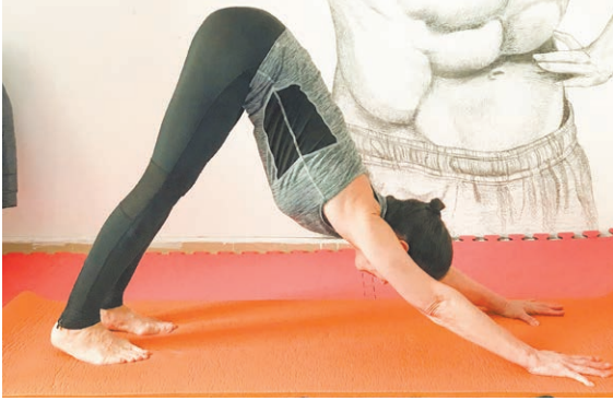
Поза собаки мордой вниз

Польза: благотворное воздействие на все тело. Мягкое растяжение мышц, улучшение кровоснабжения, в особенности это