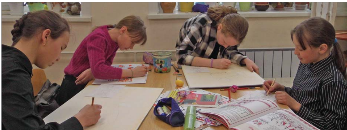
Первокурсники выводят орнаменты.