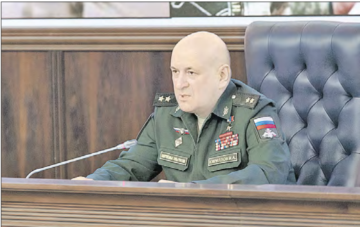
Генерал-лейтенант Игорь КИРИЛЛОВ

— В ходе реализации указанных проектов были выделены шесть семейств вирусов, включая коронавирусы, и три вида патогенных бак-