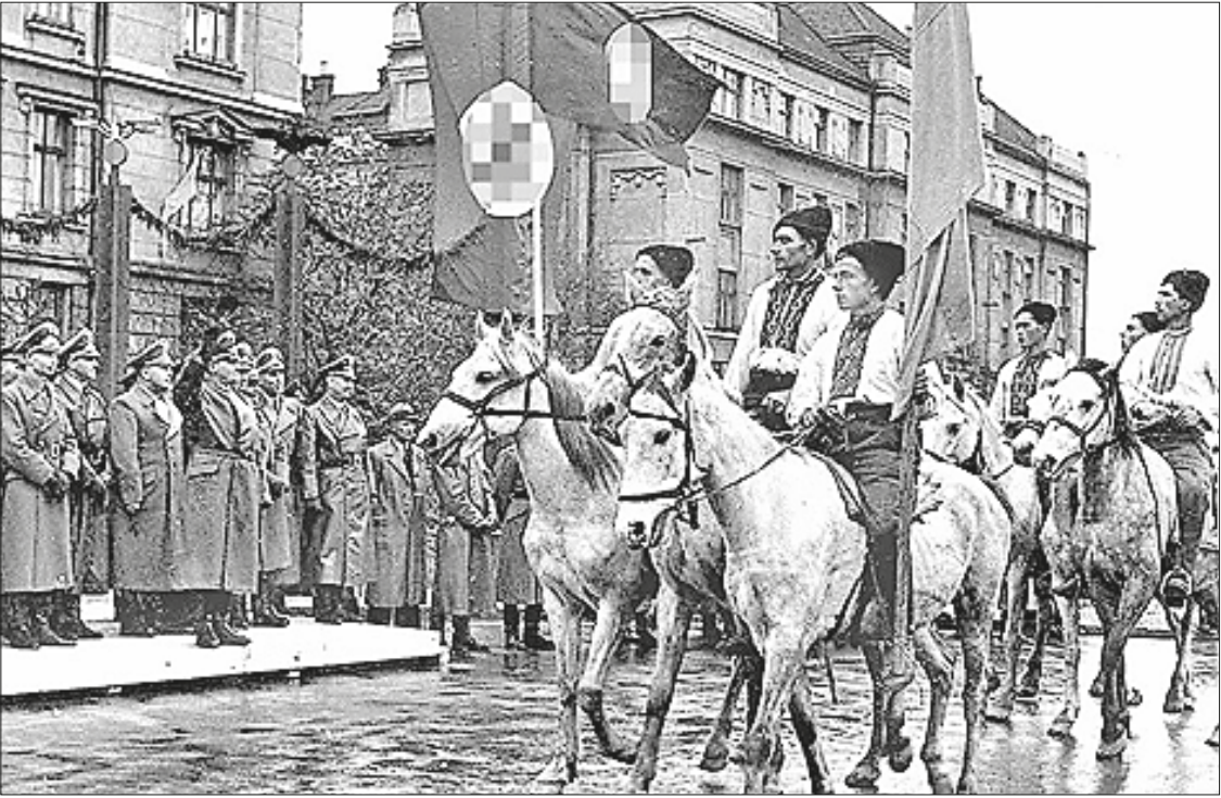
Главарь фашистской Германии приветствует украинских националистов

атации со стороны польского и советского правительств, конечной – создание самостоятельного и единого украинского государства. При этом оуновцы рассматривали тер-