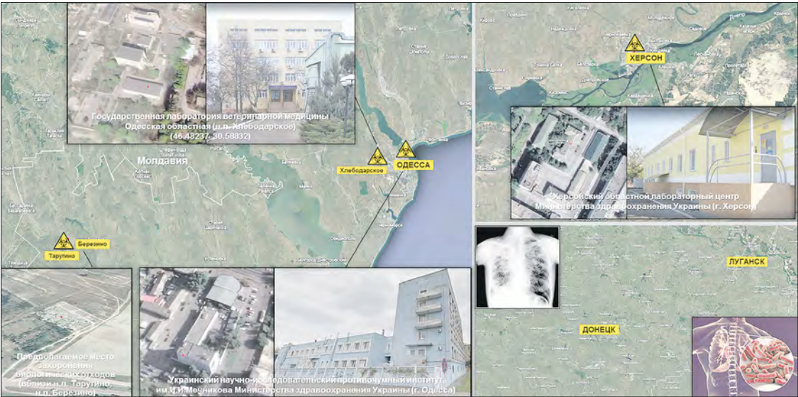
Уничтожение биоматериалов в лабораториях Украины

— Одной из причин подобной спешки может являться сокрытие сведений о возникшей в 2019 году в Херсоне вспышке дифтерийного заболевания, которая передаётся комарами. Возникает вопрос, почему четыре случая заражения выявлены именно в феврале, что нехарактерно для жизненного цикла этих насекомых даже с учётом инкубационного периода болезни. В апреле 2019 года представители Пентагона посетили местные учреждения