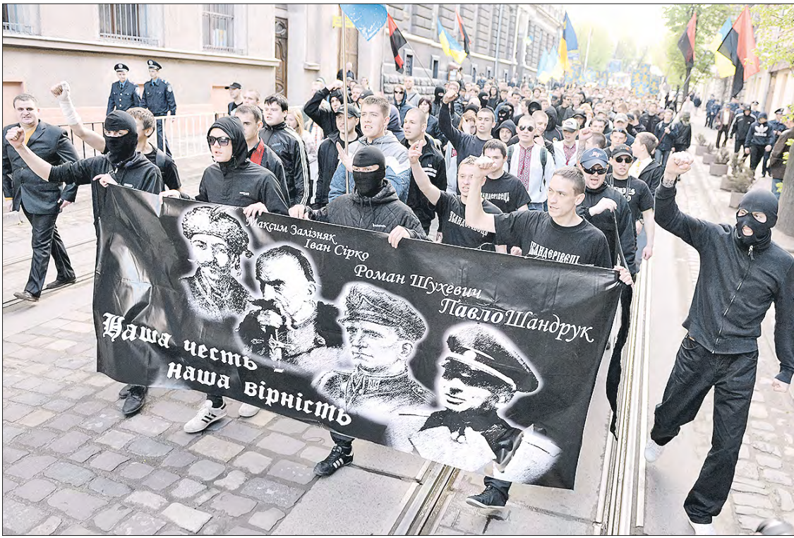
Шествия украинских националистов стали привычными и получали поддержку на государственном уровне

17 – 23 февраля 1943 года в Львовской области состоялась третья конференция ОУН, на которой было принято решение об активизации деятельности и о начале вооружённой борьбы, которую планировалось наравить не против германской оккупации, а против советских партизан и поляков. Борьба же с германскими оккупантами, как декларировалось, хотя и не исключалась, но исходя из интересов ОУН должна была иметь характер самообороны украинского народа.