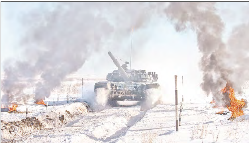
Подготовил Владислав БЕЛОГРУД.

Напомним, первый этап состязаний Армейских международных игр-2022 состоялся на территории Центрального военного округа – в регионах Урала, Сибири и Поволжья, а также на территориях российских военных баз в Таджикистане и Киргизии. В рамках соревнований по полевой и воздушной выучке военнослужащие ЦВО состязались в 27 конкурсах. В первом этапе было задействовано 17 военных полигонов ЦВО, на которых мерились силами до 3,5 тысячи взводов, отделений и экипажей боевой техники Центрального военного округа. Наиболее зрелищная борьба проходила в следующих конкурсах: «Танковый биатлон», «Авиадартс», «Снайперский рубеж», «Чистое небо» и «Военно-медицинская эстафета». Для подразделений сухопутных войск ЦВО было организовано 15 конкурсов, для Военно-космических сил (ВКС) – один конкурс, девять конкурсов – для военнослужащих иных подразделений ЦВО. Ждём новых результатов – уже мартовского, второго этапа АрМИ-2022.