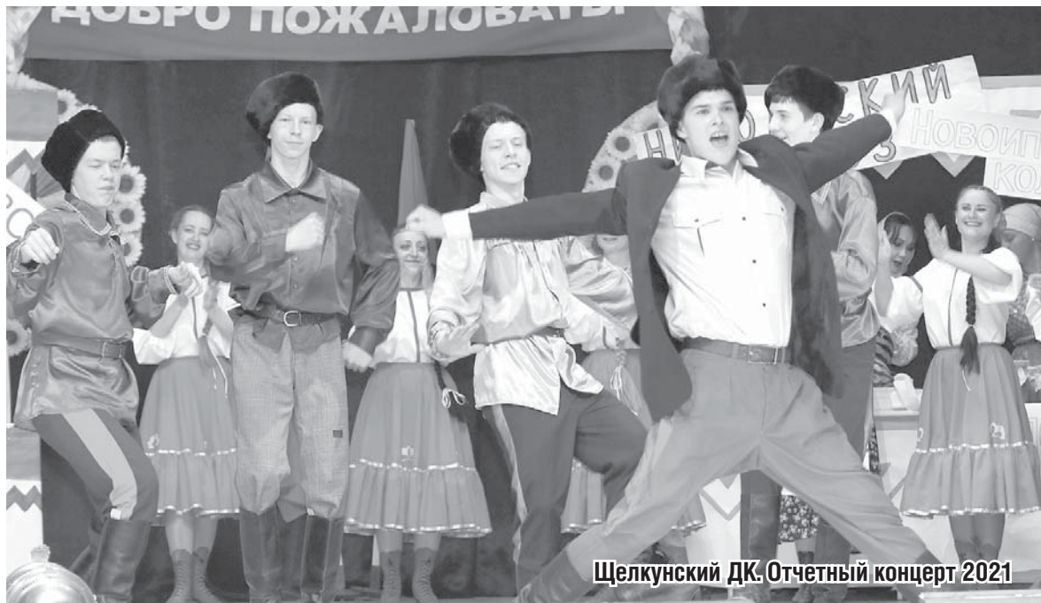
Щелкунский ДК. Отчетный концерт 2021