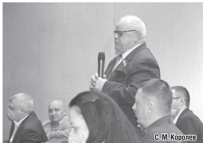
С. М. Королев

в Черданцево, в Кашине. На очереди – Кадниково, Асбест.