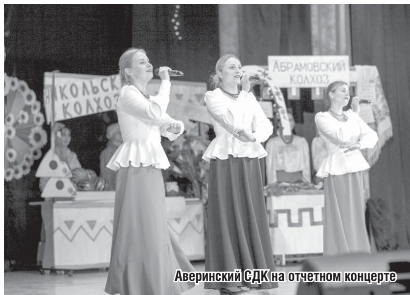
Аверинский СДК на отчетном концерте