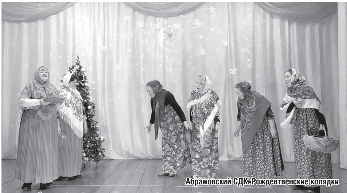
Абрамовский СДК. Рождественские колядки