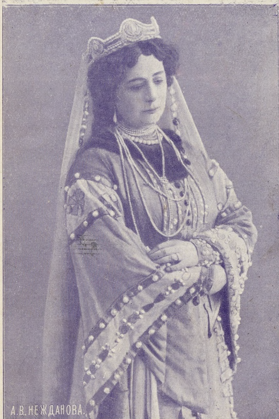
А. В. НЕЖДАНОВА.