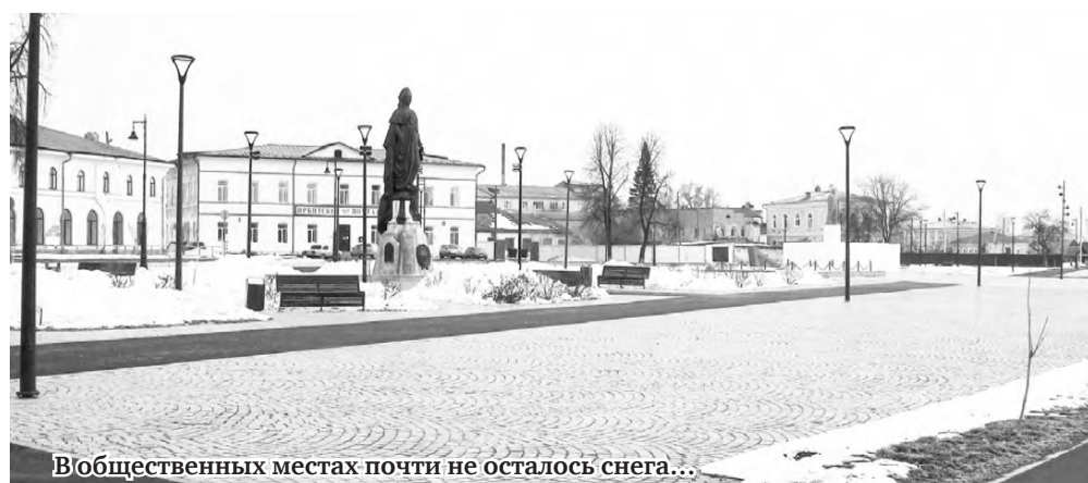
В общественных местах почти не осталось снега...

Проведена очистка от зарослей и мусора – на площади около трёх гектаров – водоохраной зоны речки Серебрянки; от валежника и мусора (около полутора гектаров) – в парке имени 40-летия ВЛКСМ. Ликвидирована 21 самовольная свалка на общей площади 350 квадратных метров, с вывозом 142 кубометров бытовых отходов.