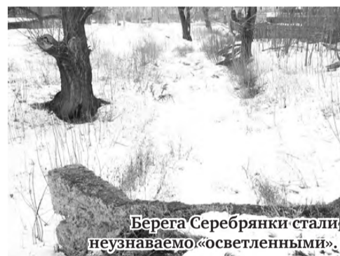
Берега Серебрянки стали неузнаваемо «осветленными».

согор по улице Мамина-Сибиряка (между Мира и Логинова), изобилующий выбоинами и ямами, в осенне-зимне-весенний период – обледеневший. А в часы пик – утром и вечером на этот участок с перегруженной улицы Комсомольской направляется значительный поток автотранспорта.