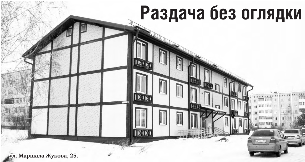
ул. Маршала Жукова, 25.