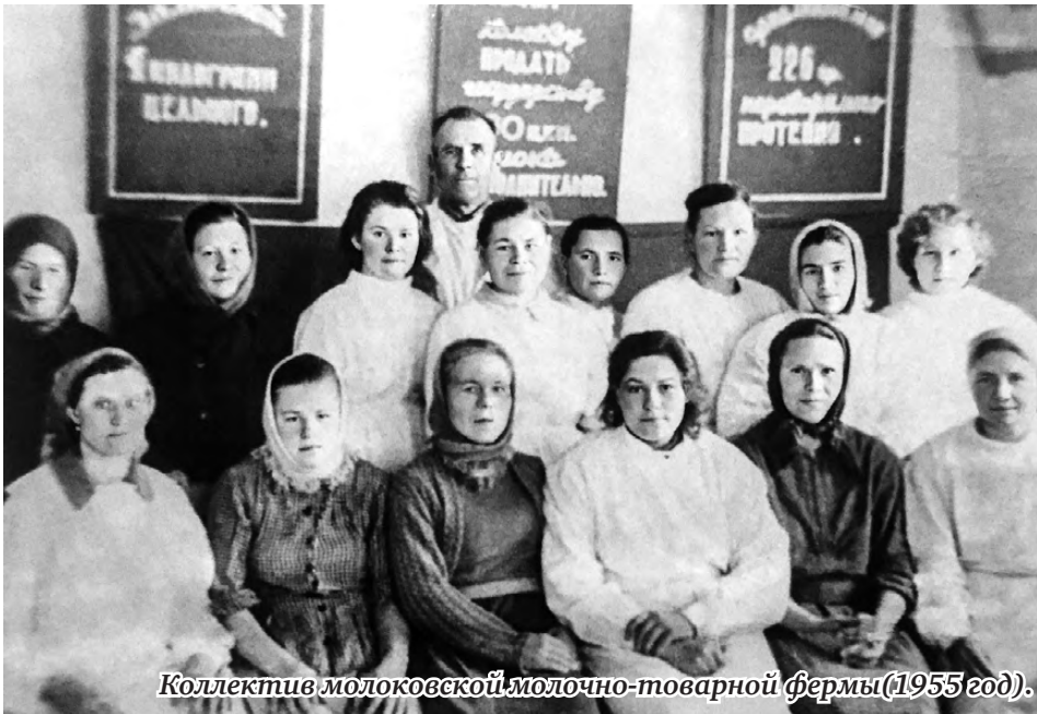
Коллектив молоковской молочно-товарной фермы (1955 год).

В середине двадцатых годов прошлого века на Урале стали образовываться колхозы. В апреле 1929 года на землях деревень Вандышева, Васино, Мельницкова, Меркушина, Молокова, Худякова, сёл Зайково и Скородумского была организована крупная артель имени И. В.Сталина.