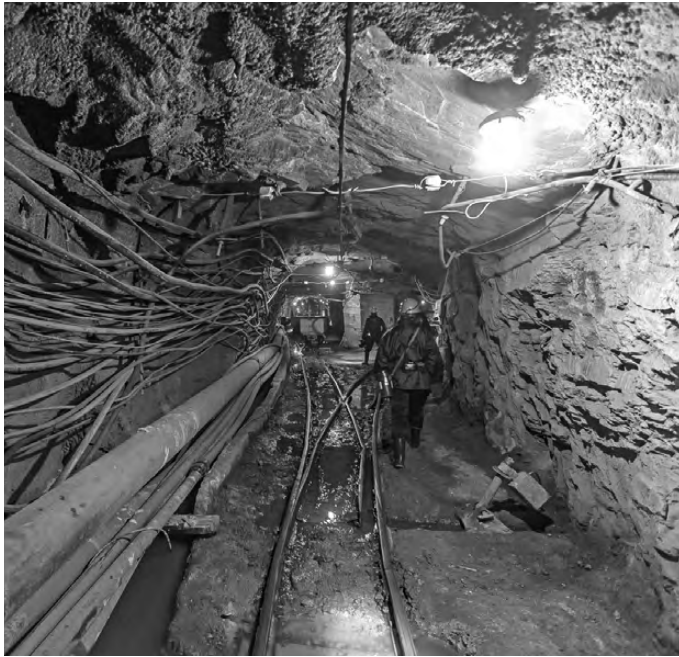
Если насосы выключить, вода затопит не только саму шахту, но и часть города Березовского.

В настоящее время резервный источник питьевого водоснабжения для Екатеринбурга—Нязепетровское водохранилище, расположенное на реке Уфе в Челябинской области. Там построены все необходимые транспортные каналы, установлено оборудование, и воду при необходимости—в засушливые периоды—используют, перекачивая в Чусовую. Но тут плечо доставки ресурса—свыше 100 километров. ●