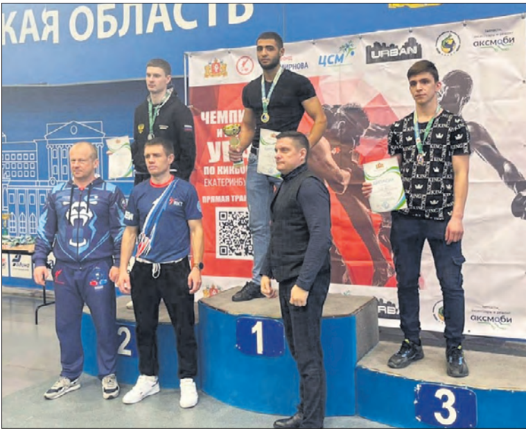
Фото секции «Старт»