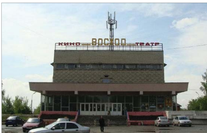
Кинотеатр «Восход» любим первоуральцами.