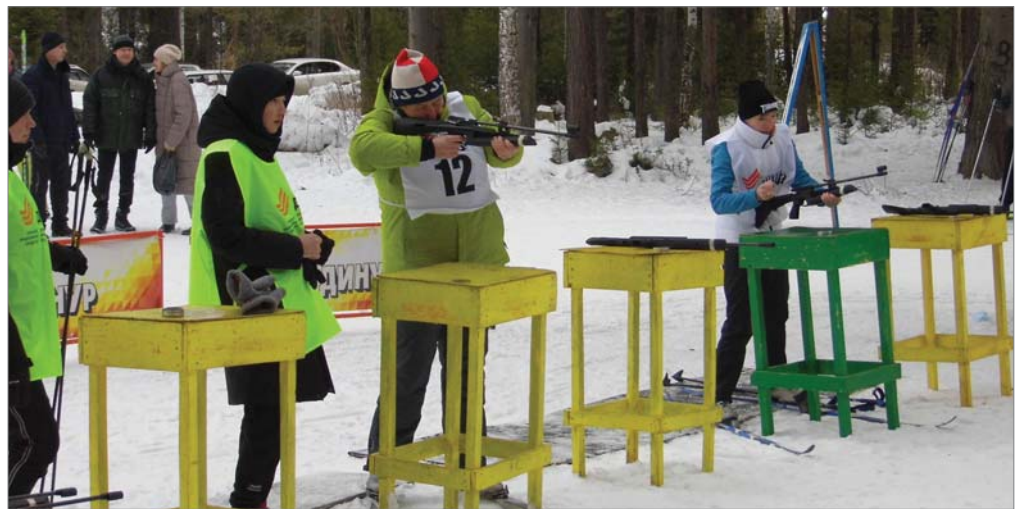
На огневом рубеже.

Самой меткой по итогам первенства стала сборная рудника и СЗС, самой быстрой – команда заводоуправления.