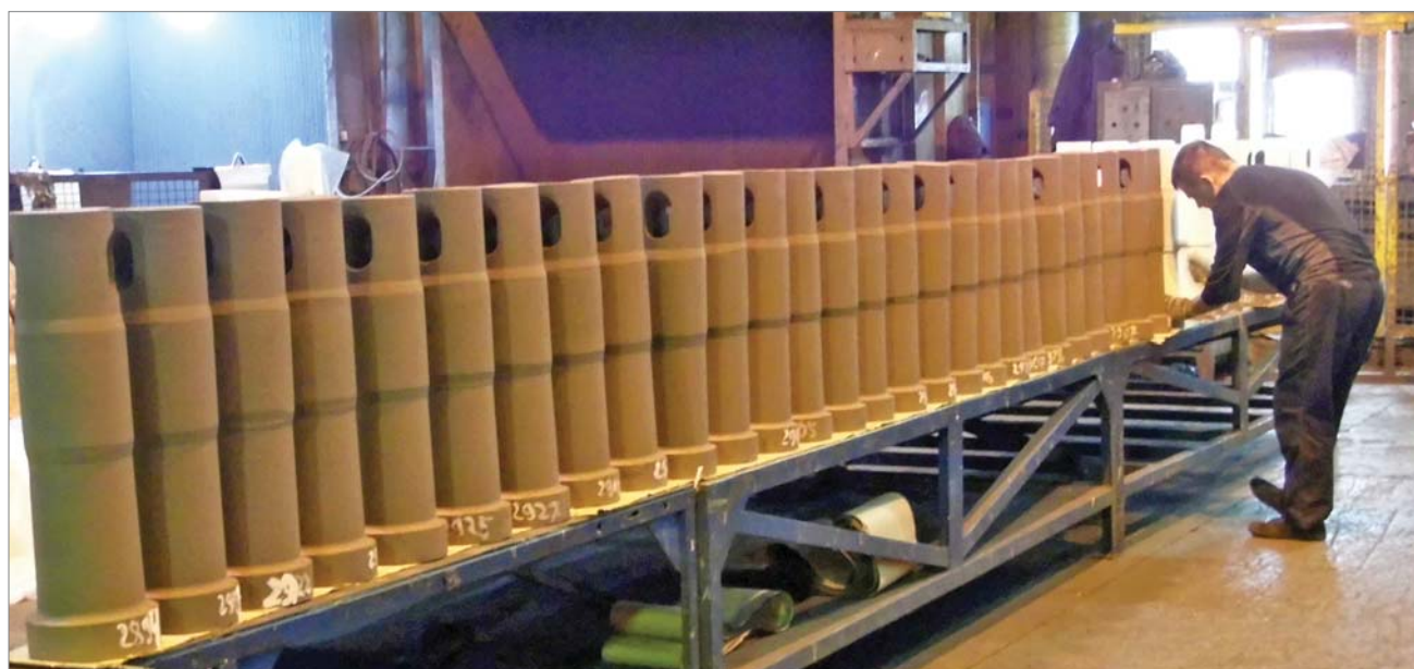
Корундографитовые изделия упаковываются и готовятся к отправке металлургам.