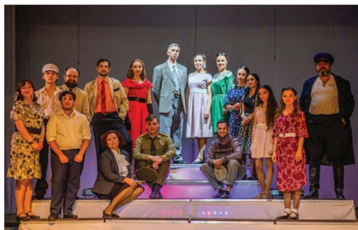
Сцена из спектакля «Оттепель» театра «Вариант».