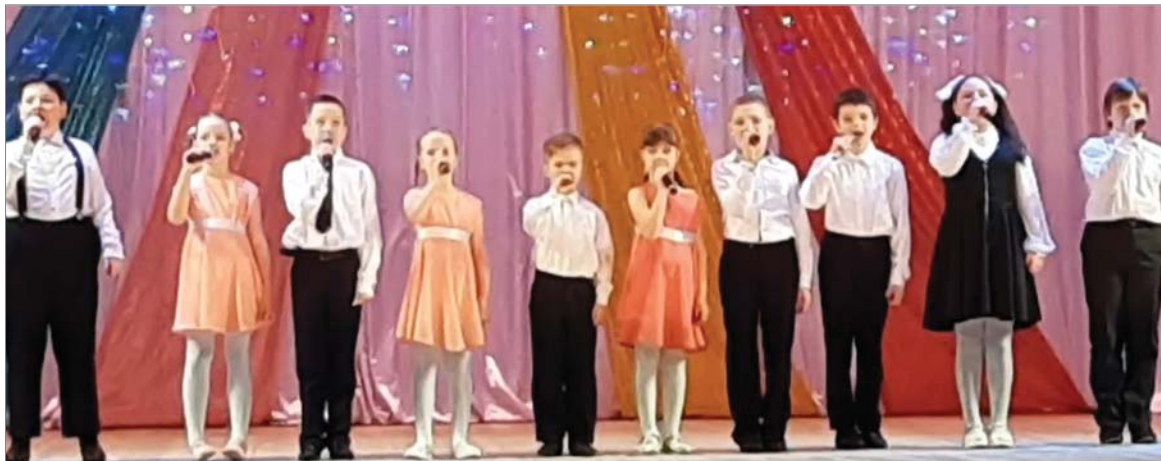
На сцене - ансамбль «Звёздочки».

Несмотря на то, что уральский март не жалуется на весенней погодой, заводской ДК гудит, как улей – во Дворце культуры Первоуральского динасового завода «Весенний бум».