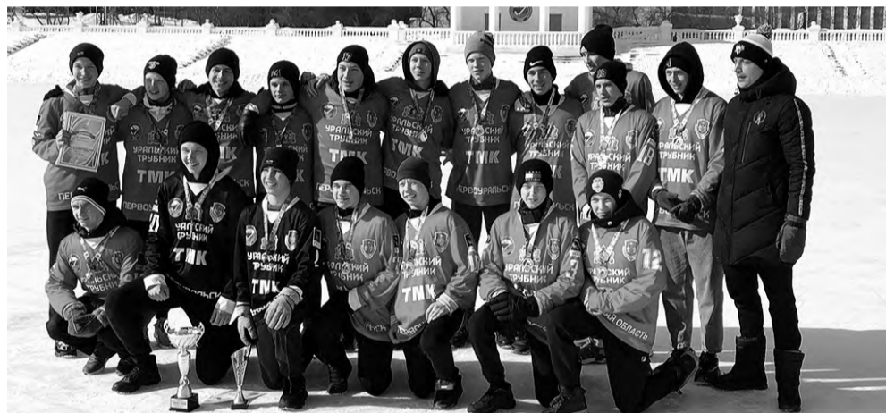
Команда «Уральский трубник» – победитель Первенства Свердловской области среди юношей 2004-2005 г.р.

Итоговое положение команд: «Уральский трубник-2006» (Первоуральск) – 19 очков, «Маяк» (Краснотурьинск) – 17, «Уральский трубник-2005» (Первоуральск), «СШОР-18» (Екатеринбург) – по 9, «Уральский трубник-2004» (Первоуральск) – 8.