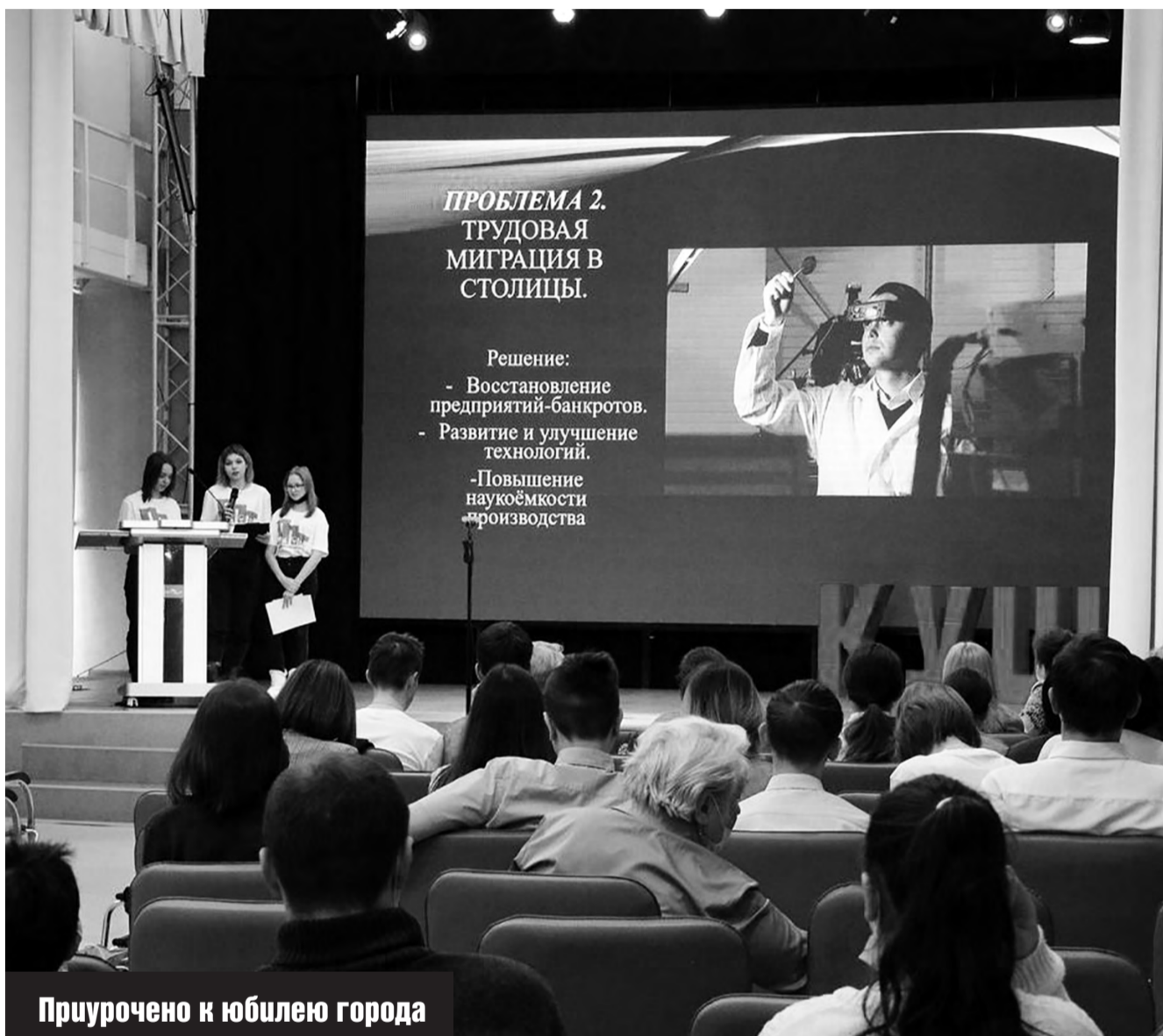
Приурочено к юбилею города

Ожидается, что в 2022 году в Первоуральске в первые классы пойдут чуть больше двух тысяч детей.