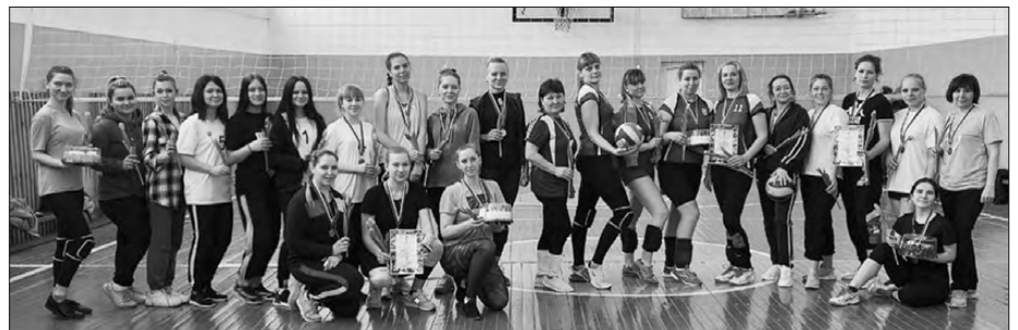
Материалы с сайта администрации Каменского городского округа

Команды показали зрелищную игру и соревновательный дух. В упорной борьбе 1-е место заняла команда Мартюша, 2-е место – команда из Сосновского, 3-е место – из Маминского. За волю к победе награждена женская волейбольная команда из Покровского. Организаторы турнира подарили каждой участнице повод для улыбки, передав им теплые пожелания и весенние цветы. Организаторы соревнования выражают благодарность Каменскому местному отделению партии «Единая Россия» за предоставленные сладкие призы.