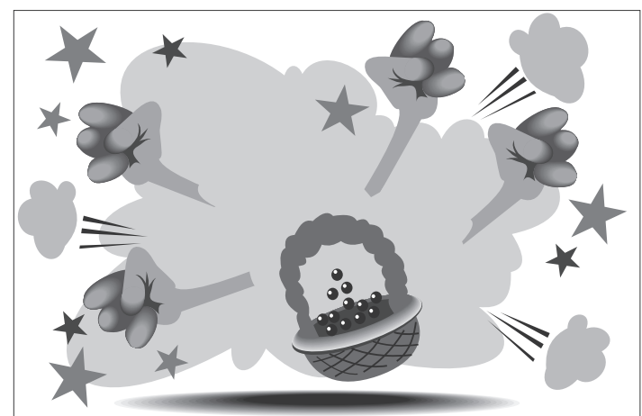
иллюстрация ПЕТРА УПОРОВА.

Две группы сборщиков ягод устроили массовую драку в городе Евле в центральной части Швеции. В потасовке участвовали примерно 70 человек.