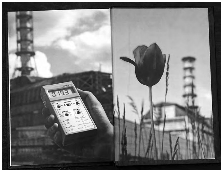
Страницы книги «Авария Чернобыльской атомной станции (1986–2011 гг.): последствия для здоровья, размышления врача».

В министерстве энергетики и жилищно-коммунального