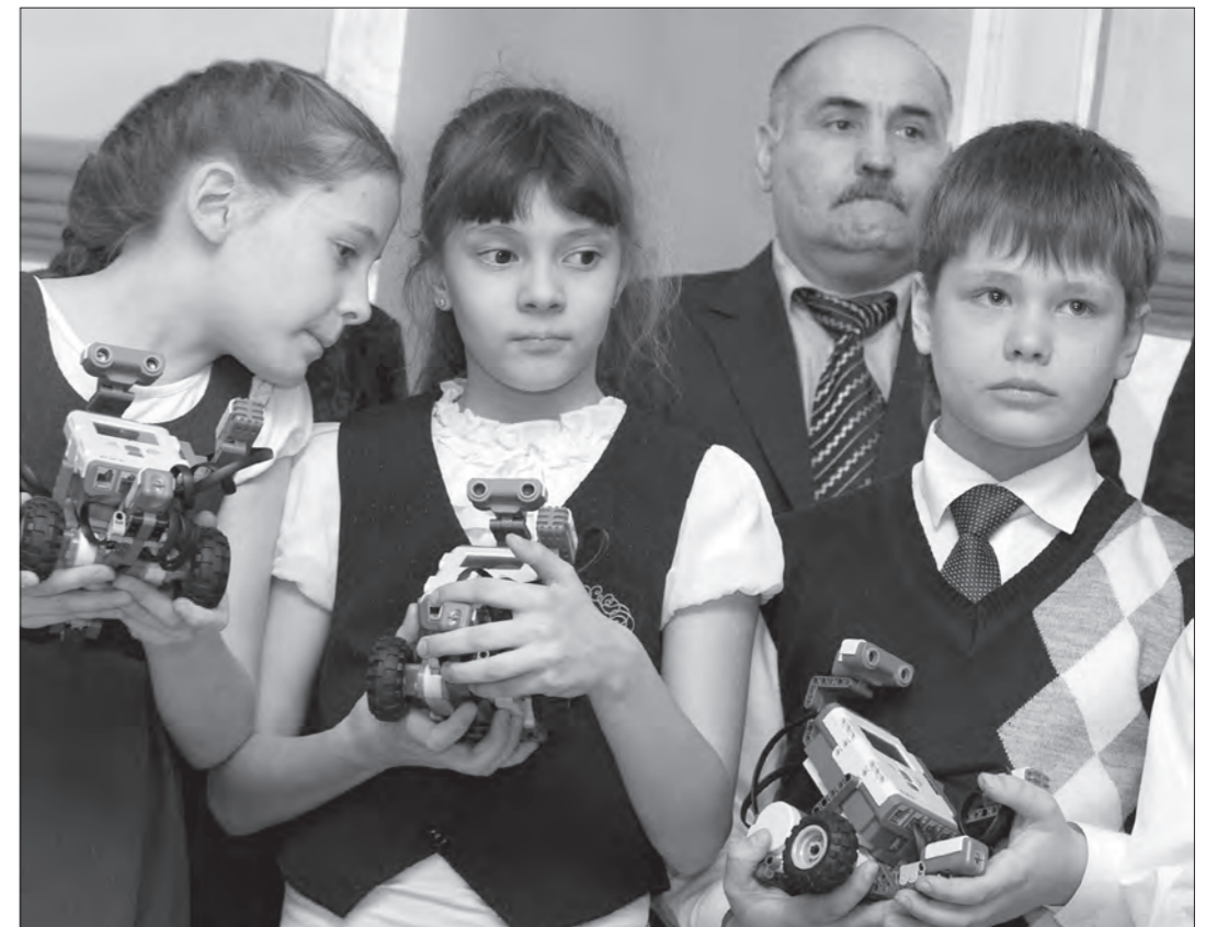
Юные роботостроители и заместитель главы администрации города по социальным вопросам Валерий Суров.