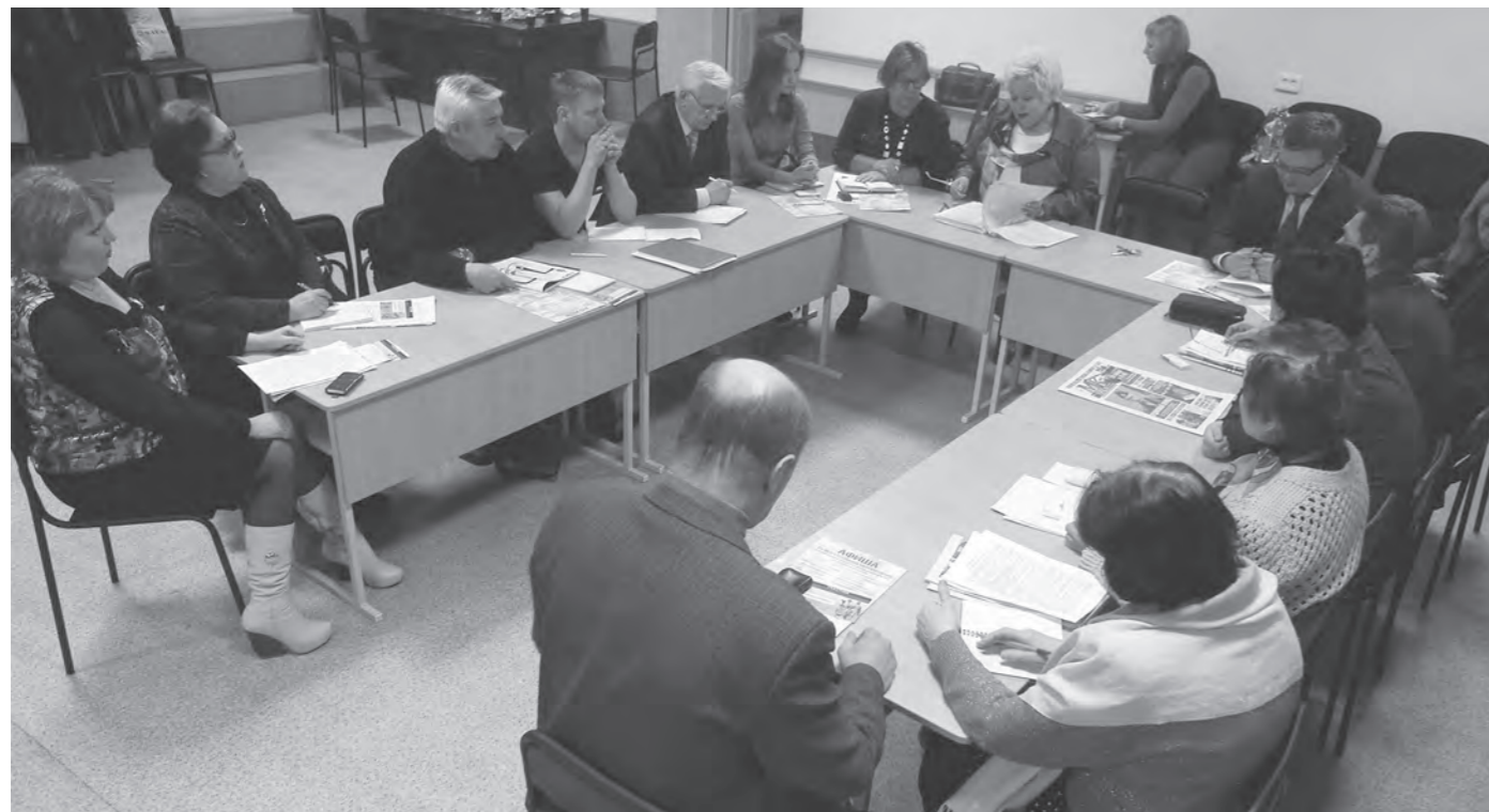
Идет заседание народного штаба.