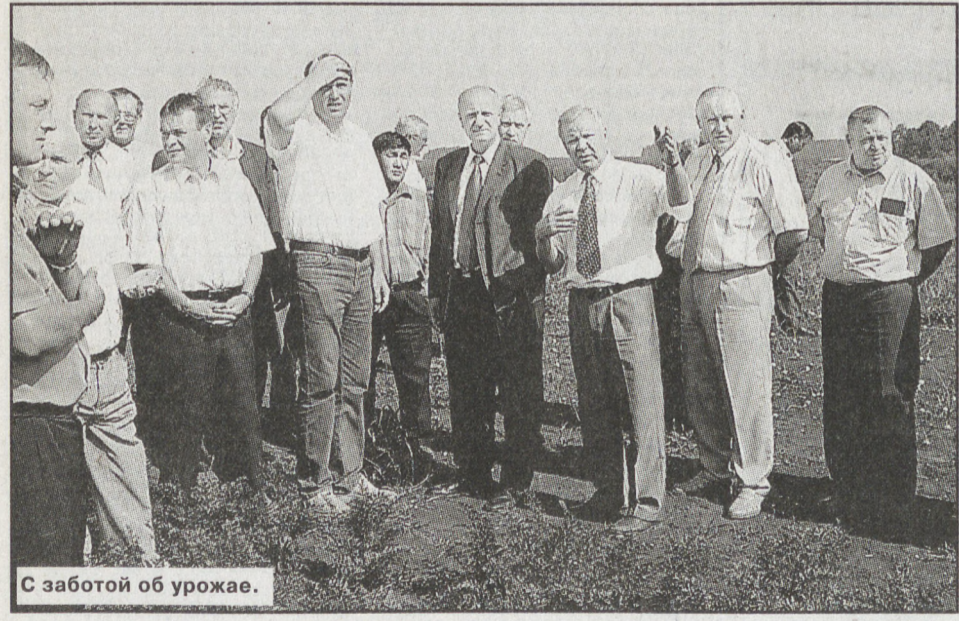
С заботой об урожае.