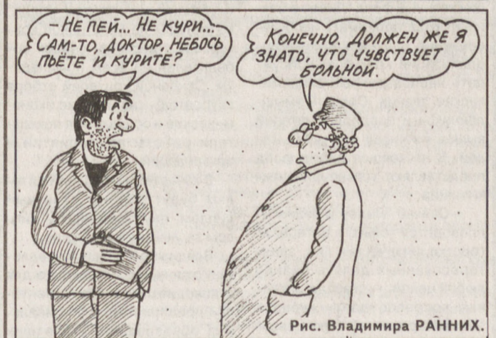
Рис. Владимира РАЙНИХ.

Погода По данным Уралгидрометцентра, 22 апреля ожидается облачная погода с прояснениями, местами — кратковременные осадки в виде дождя, в северных районах области — мокрого снега. Ветер северо-западный, 5—10 м/сек. Температура воздуха ночью минус 2... плюс 3, днем плюс 4... плюс 9, на юго-западе области до плюс 14 градусов.