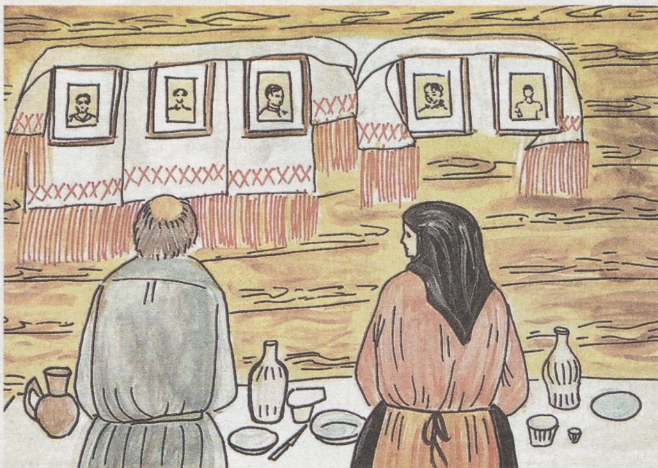
Рисунок Лили ХАЙДАРОВОЙ, 12 лет.