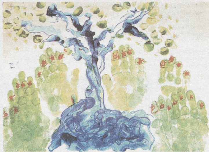
Рисунок Димы и Алёши БУЗУНОВЫХ, по 9 лет.