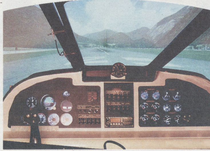
На тренажёре всё как в настоящей кабине.