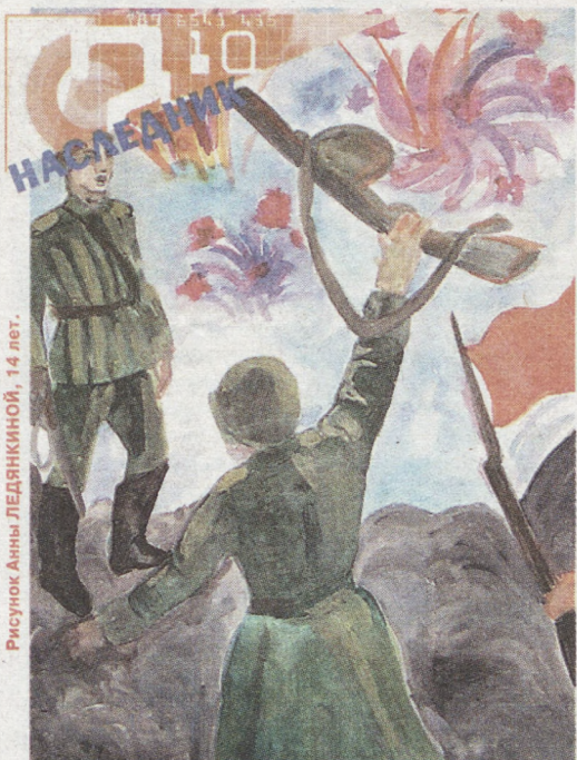
Рисунок Анны ЛЕДЯНКИНОЙ, 14 лет.