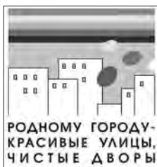
РОДНОМУ ГОРОДУ - КРАСИВЫЕ УЛИЦЫ, ЧИСТЫЕ ДВОРЫ

Ко мне приехала подруга, которая уже 17 лет живет в Минске. Раз в три-четыре года обязательно бывает в Нижнем Тагиле. В субботу мы бродили по городу целый день, она с удивлением открывала для себя известные с детства уголки, и я по-новому смотрела на улицы и скверы уже словно бы ее глазами.