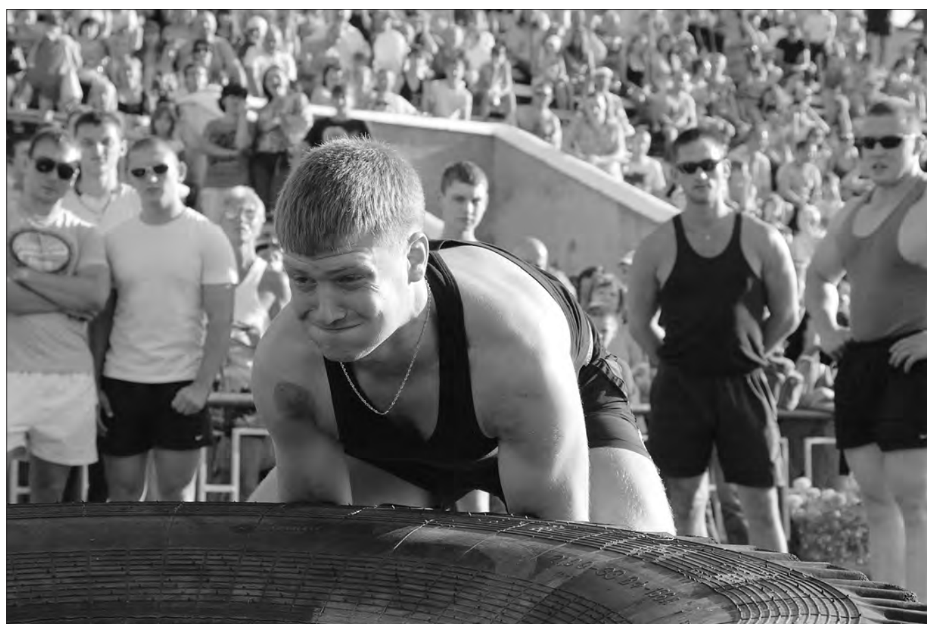
Участники чемпионата города-2011.