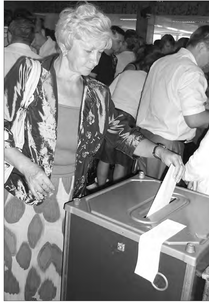
Идет голосование.