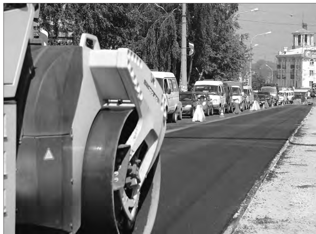
Работы ведутся на участке интенсивного движения - возле ТЦ «Монетка-супер» на улице Фрунзе.

Всю прошлую неделю асфальтировали дорогу по улице Фрунзе. Начали от перекрестка с улицей Космонавтов, пройти предстоит до улицы Черных.