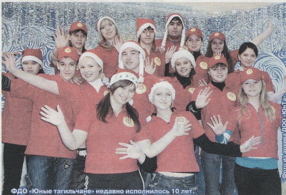
ФДО «Юные тагильчане» недавно исполнилось 10 лет.

Обычно всё начинается с класса – скучно приходить только на уроки, почему бы не организовать какое-то мероприятие? Современный школьник одними знаниями сыт не будет. Самоуправление позволяет ученикам влиять на политику школы, менять к лучшему жизнь в своём маленьком государстве. Школьные советы объединяются в советы городские, городские – в областные. Одной