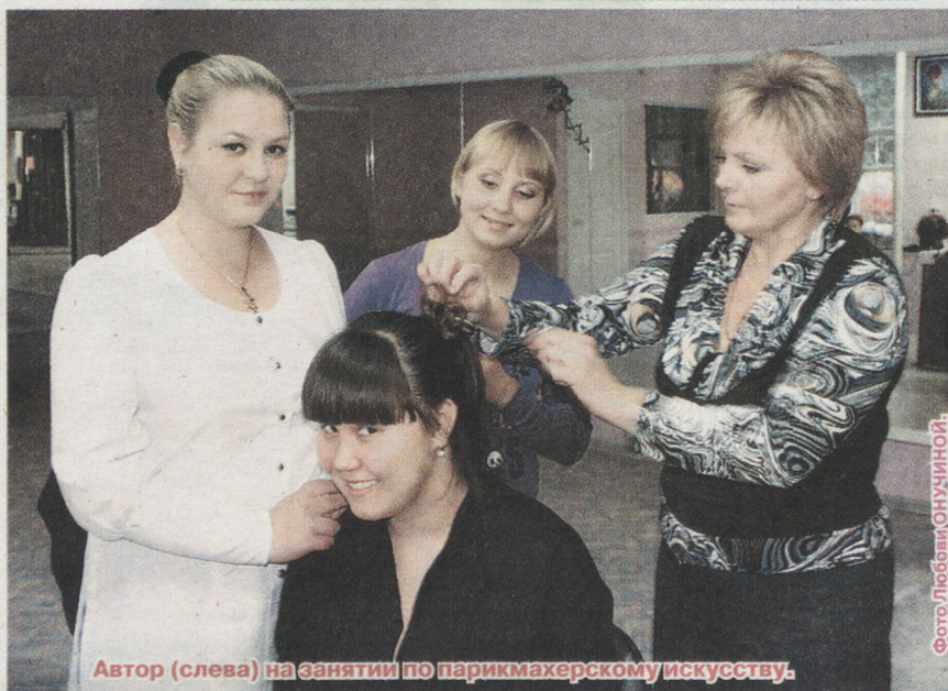
Автор (слева) на занятии по парикмахерскому искусству.