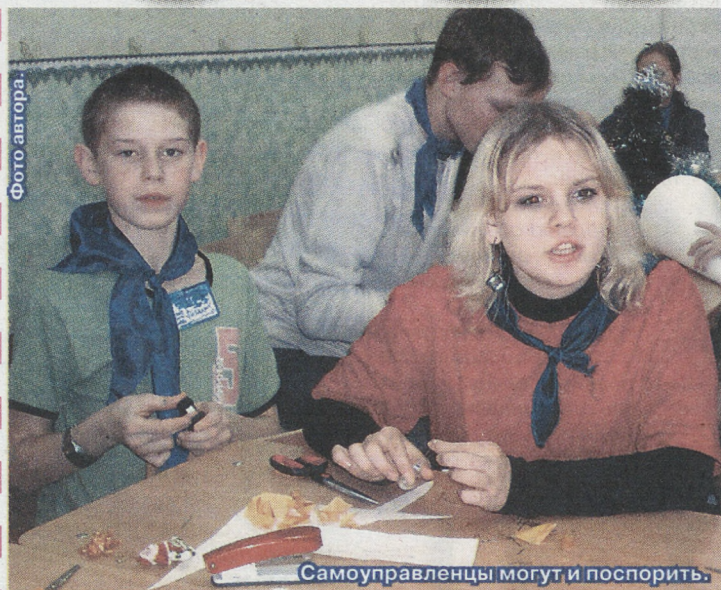
Самоуправленцы могут и поспорить.

из самых крупных таких организаций в Свердловской области можно назвать «Ассоциацию учащейся молодёжи», на сегодняшний день в неё входит сорок объединений. Но насколько они серьёзны, и нужна ли педагогам такая школьная активность? Оказывается, не всегда.