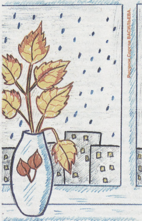
Рисунок Сергея ВАСИЛЬЕВА.

*** Осень наступила. Дует ветер злой. Листья все опали, Стелются ковром. Птицы улетают В дальние края. И на санках скоро Кататься буду я.