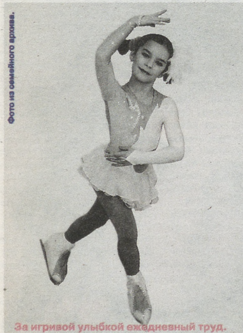
За игривой улыбкой ежедневный труд.

Кто-то без сучка и задоринки исполняет сложные прыжки, кто-то – вращения, а кто-то запоминается неповторимым артистизмом... Со стороны кажется, что всё это даётся фигуристам без видимых усилий – легко и просто.