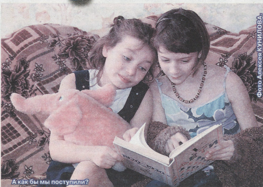
А как бы мы поступили?