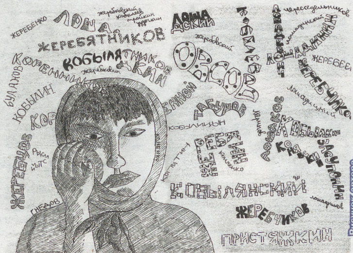
А рассказ Антона Чехова «Лошадиная фамилия» вдохновил меня на этот рисунок.