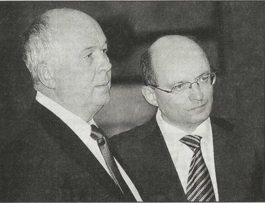
Губернатор Свердловской области Александр Мишарин и генеральный директор госкорпорации «Ростехнологии» Сергей Чemezov 18 сентября представили президенту компании «Боинг» — Гражданские самолёты» Джеймсу Албау производственные площадки корпорации «ВСМПО-Ависма».