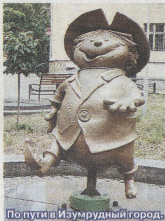
По пути в Изумрудный город.