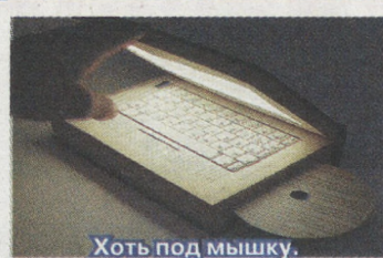
Хоть под мышку.