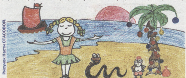
Рисунок Насти СТАСОВОЙ.