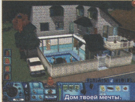
Дом твоей мечты.

Разработчики симулятора человеческой жизни поражают игроков уже третьей частью своей игры. Теперь «Sims 3» дополнена множеством новых функций и интересных деталей. Игра воспроизводит реальную жизнь человека, только в ускоренном темпе и в уменьшенном масштабе.