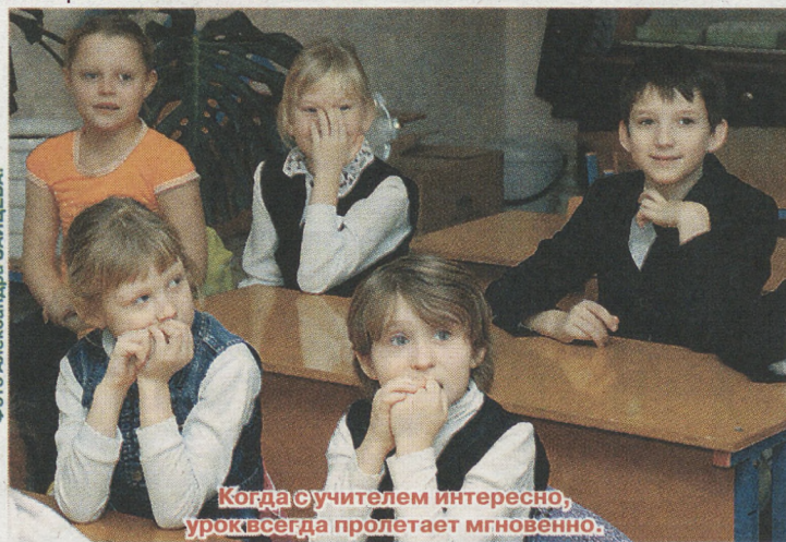
Когда учителем интересно, урок всегда пролетает мгновенно.

сидим мы втроём на паре: он, моя однокурсница София и я. Он из Польши, мы тоже не из Екатеринбурга, изучаем, как называются по-польски всякие разносолы и вспомина-