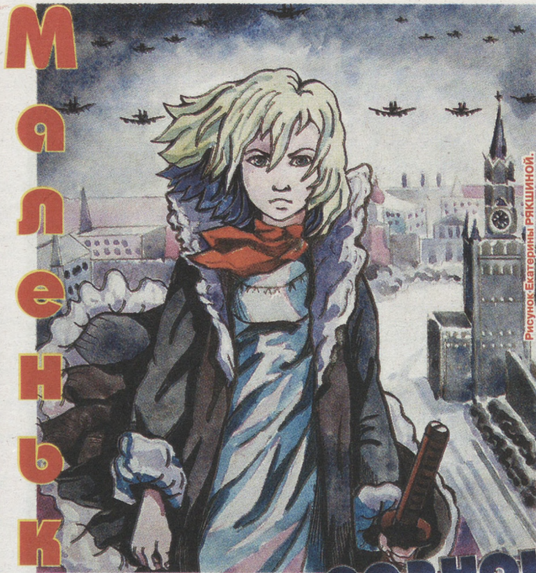
Рисунок Екатерины РАКШИНОЙ.

риальная доска. А в школе № 140, где она училась, есть музей.