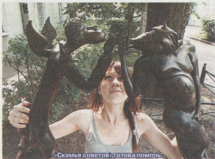
«Скамья советов» готова помочь.