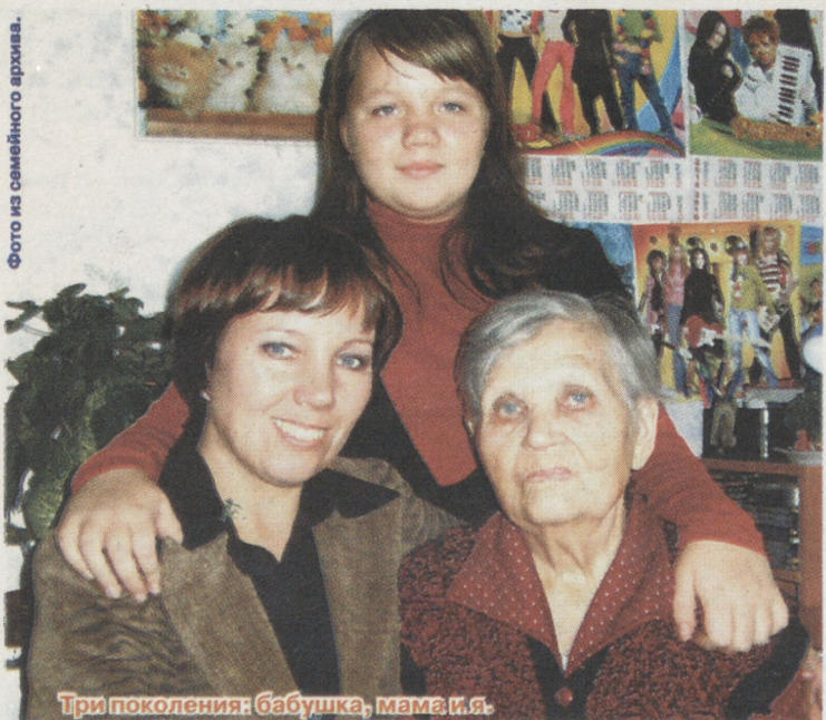
Три поколения: бабушка, мама и я.

На её долю выпала военная юность, тяжёлая работа на земле в мирные годы, но было и большое счастье. Вот об этом я и хочу рассказать.