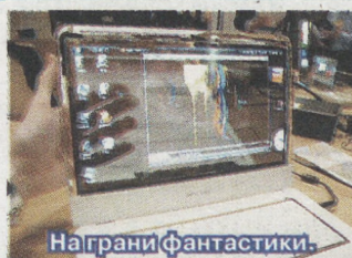
На грани фантастики.