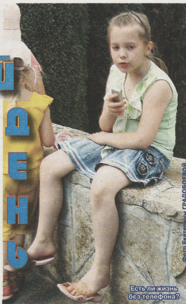
Есть ли жизнь без телефона?