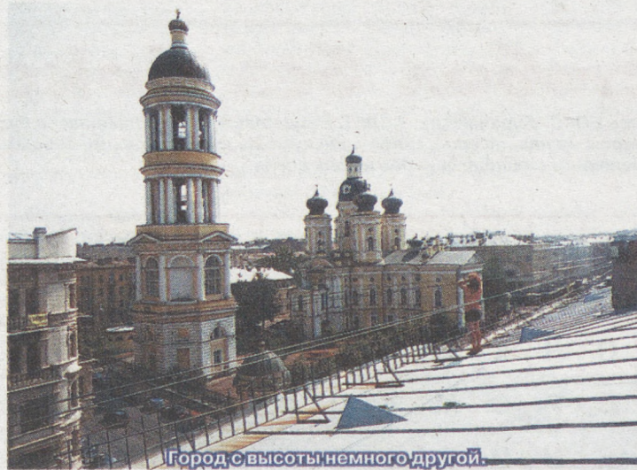
Город с высоты немного другой.