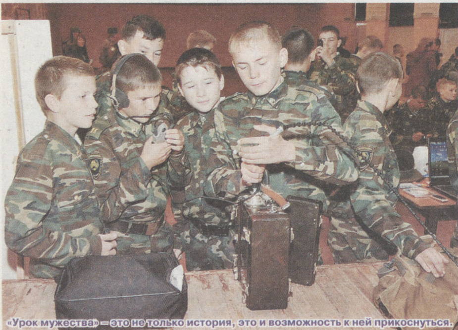
«Урок мужества» – это не только история, это и возможность к ней прикоснуться.