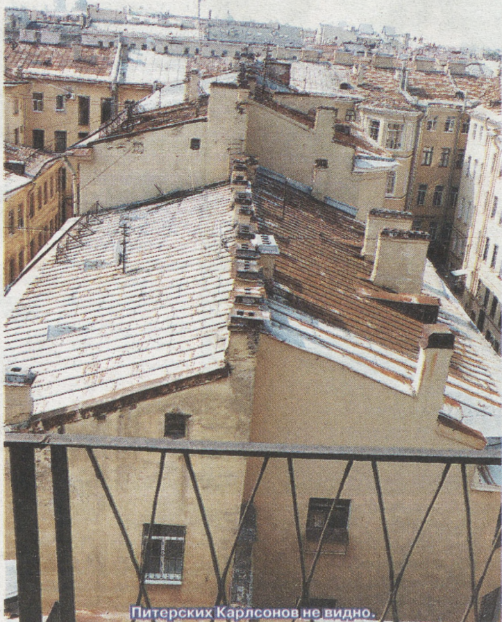
Питерских Карлсонов не видно.