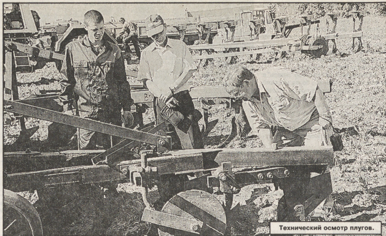
Технический осмотр плугов.