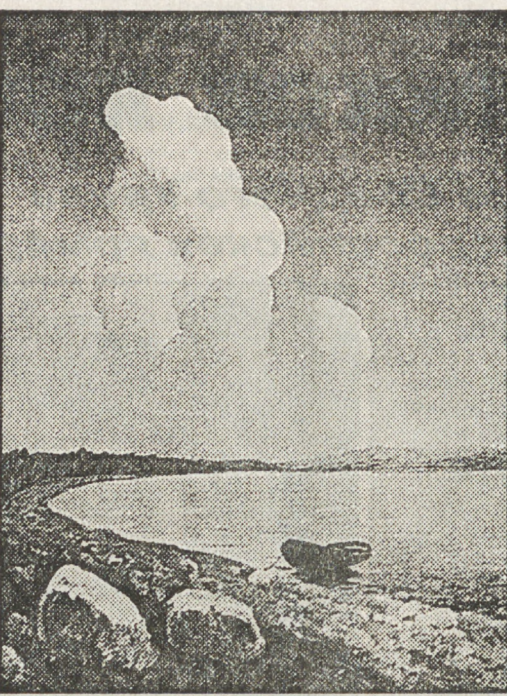
Облако у реки Чусовой.

Наиболее значительной из этой серии полотен была, по-видимому, картина «Эффект облака близ Екатеринбург». В современной художнику печати она была оценена как «особенно интересная и эффектная по сюжету и исполнению».