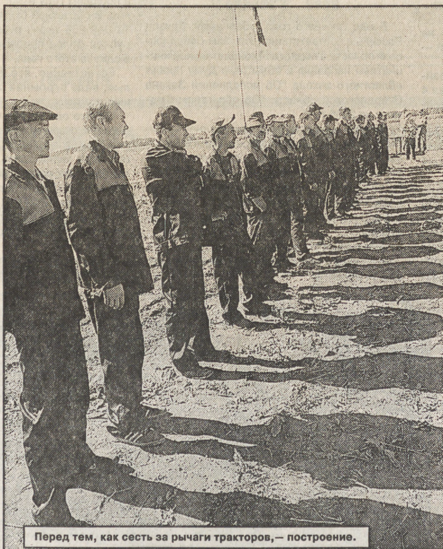
Перед тем, как сесть за рычаги тракторов, — построение.

В минувшую пятницу одно из полей за селом Останино, что близ Режа, стало арендой состязания лучших трактористов области. Здесь прошел областной конкурс механизаторов-пахарей.