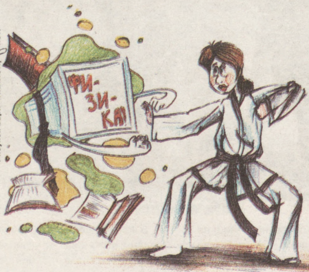
Рисунок Вари ЧИКИНОЙ, 15 лет.

будущей специальности Даша выбрала новые компьютерные технологии. При конкурсе в 20 человек на место юная мастер спорта России успешно справилась с