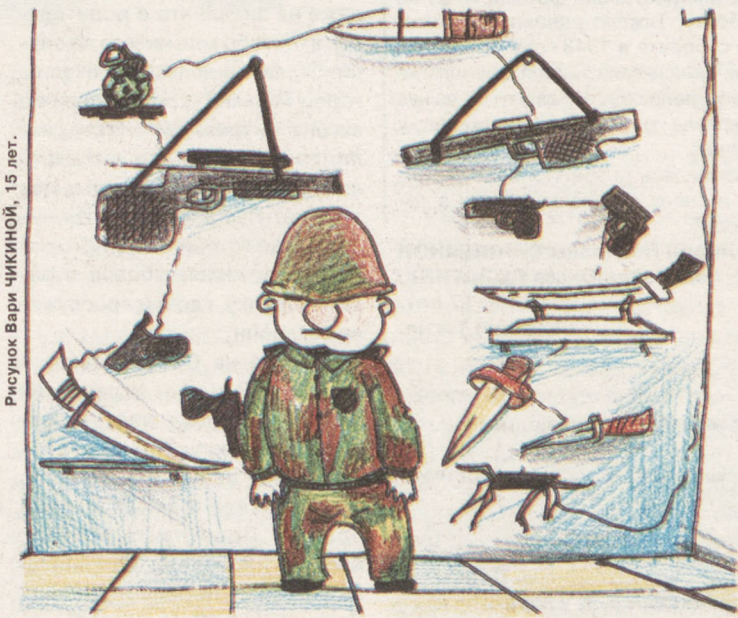
Рисунок Виты ЧИКИНОЙ, 15 лет.