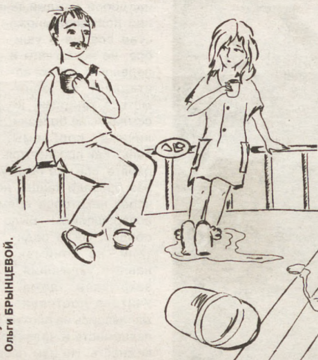
Рисунок Ольги Брынцева