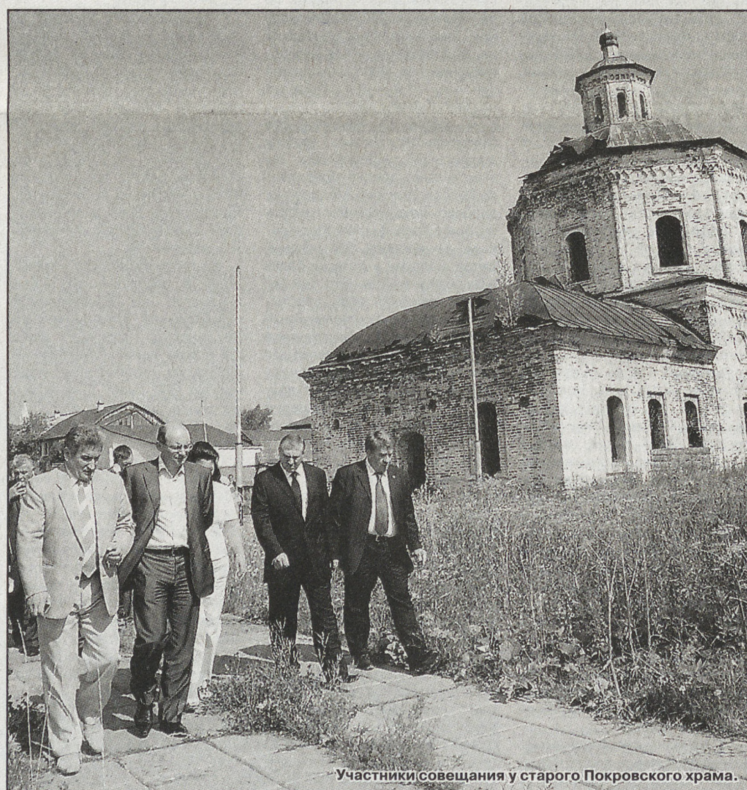
Участники совещания у старого Покровского храма.