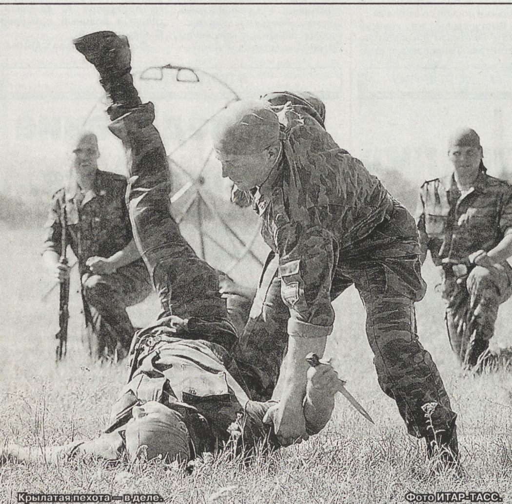
Крылатая пехота – в деле.