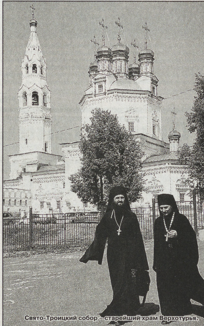
Свято-Троицкий собор — старейший храм Верхотурья.