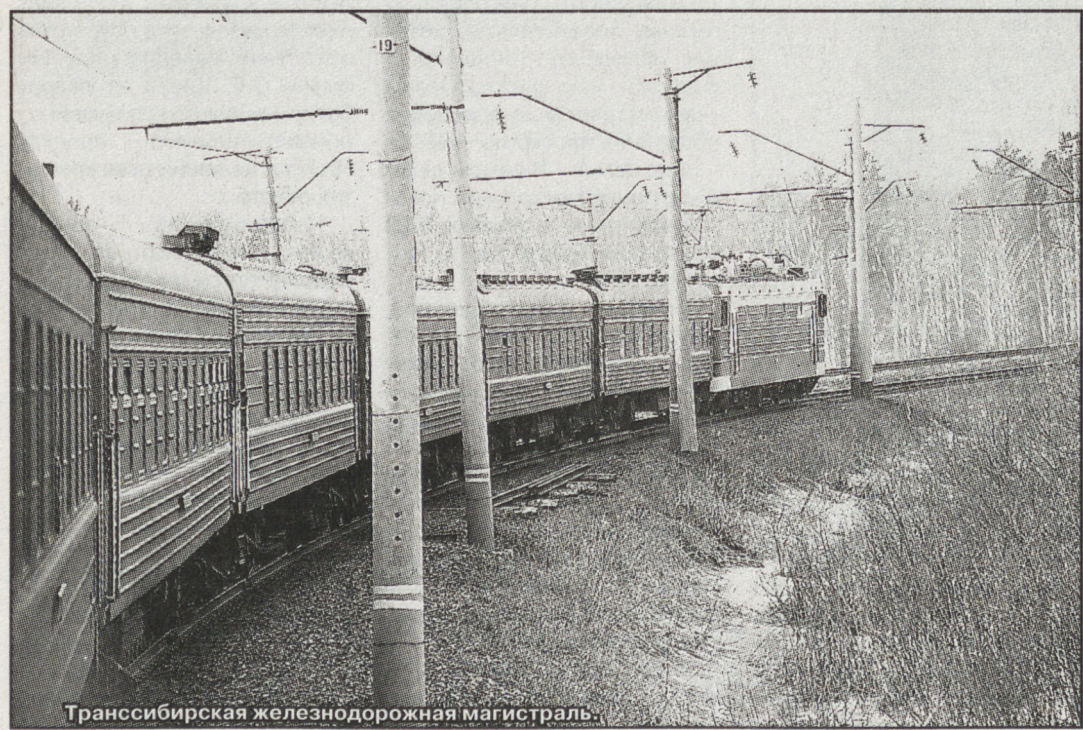
Транссибирская железнодорожная магистраль.