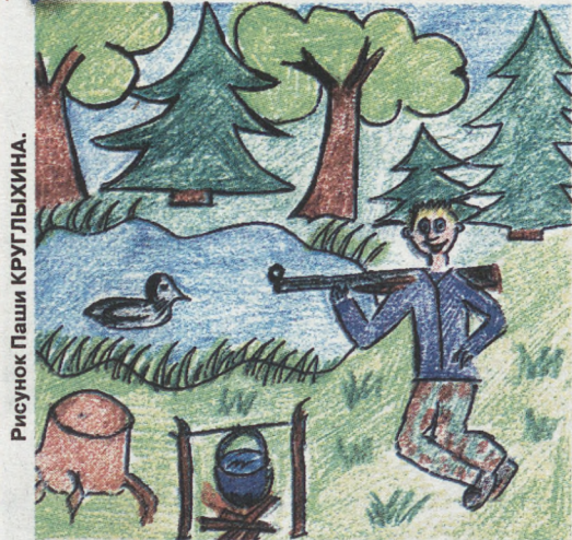
Рисунок Паши Круглыгина.

Однажды мы с папой собирались пойти на охоту, но папа уехал на работу. Я испытывал грусть. Но вдруг к воротам подъехал дедушка и сказал: «Серёжа, собирайся на охоту!». Упрашивать меня было не надо.