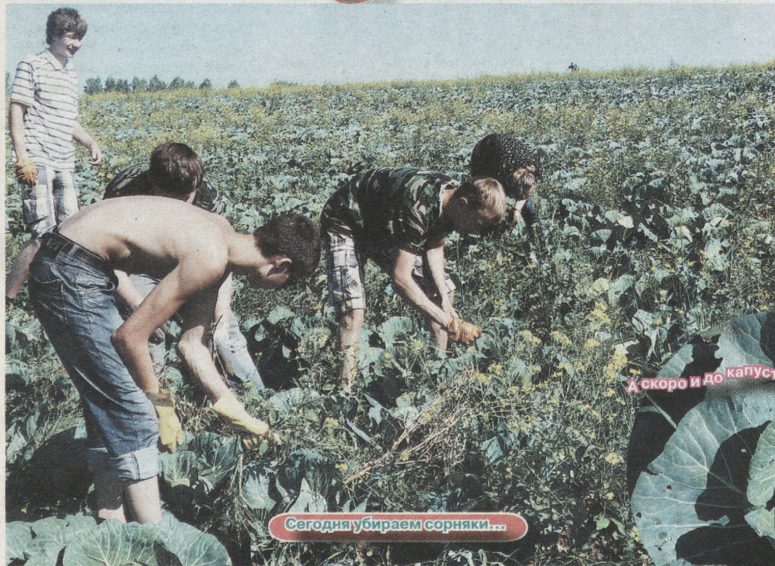
Сегодня убираем сорняки...

Вокруг всё такое зелёное. Но если зелёная капуста — дело хорошее, то не менее зелёные сорняки — дело неприятное. С ними-то и борются трудовые отряды, созданные в некоторых районах Екатеринбурга. Ежедневно к девяти утра несколько десятков ребят приезжают в поля хозяйства «Тепличное», раскинувшиеся недалеко от посёлка Садовый. На руках — перчатки, на ногах — непромокаемая обувь. Теперь, заняв удобное положение, можно двигаться по капустным грядкам, уничтожая на пути навязчивые сорняки. Работа непростая, но ежегодно число желающих поработать не уменьшается.