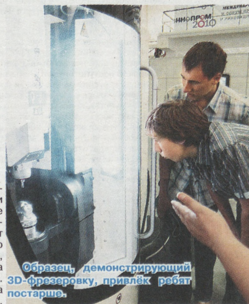
Образец, демонстрирующий 3D-фрезеровку, привлёк ребят постарше.

Детям нравятся подобные выставки, ведь благодаря им они видят, чем живёт их страна, кем они могут стать в будущем, в каком направлении должны уже сейчас развиваться. Спасибо всем организаторам за подаренный ребятам шанс знакомства с российской промышленностью и инновациями.