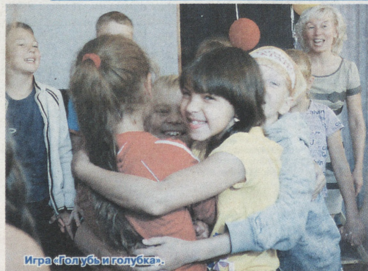
Игра «Голубь и голубка».