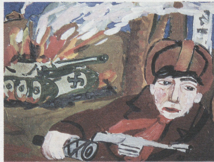
Рисунок Алексея ТУКМАЧЕВА, 9 лет. г. Нижний Тагил.