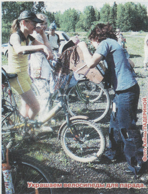
Украшаем велосипеды для парада.

Ну и конечно, не стоит забывать, что лето в деревне это не только работа, но и отдых, и при-