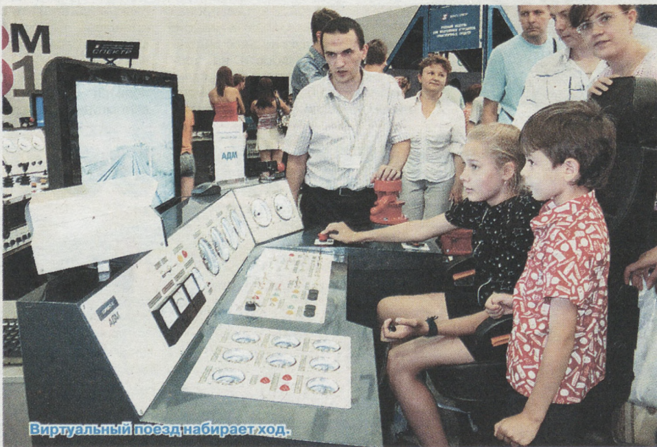
Виртуальный поезд набирает ход.

–Голова кружится от увиденного – это неопределимо, это надо действительно видеть! Мне так же, как и всем, запомнились все новые изобретения, техника, но я скажу про другое. Мы были на мастер-классе у Вячеслава Спесивцева. Мне очень понравились его слова про детей, про актёрское мастерство. Очень жаль, что на наших телеканалах не увидеть его ток-шоу «Осторожно, дети!». Думаю, мы бы смогли многому научиться. Также я приняла участие в концерте, который проходил у одного из па-