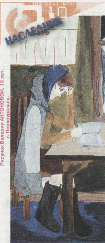
Рисунок Валерии АНТОНОВОЙ, 13 лет. г. Первоуральск.