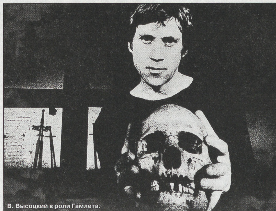
В. Высоцкий в роли Гамлета.

Сегодня телевидение конструирует реальность. Высоцкий ему, как и всей нашей системе, не нужен. Официальная концепция, в том числе и ТВ: жизнь — праздник. Нечего замораживать голову себе и людям, всё — просто. Высоцкий абсолютно противостоит отношению к жизни, как незамысловатому чему-то. У него, наоборот, любой банальный факт жизни вырастает в философское осмысление. О нём можно говорить как о философствующем певце. Он — абсолютно живой. Прямо по Пастернаку: «Быть живым, и только. Живым, и только до конца».