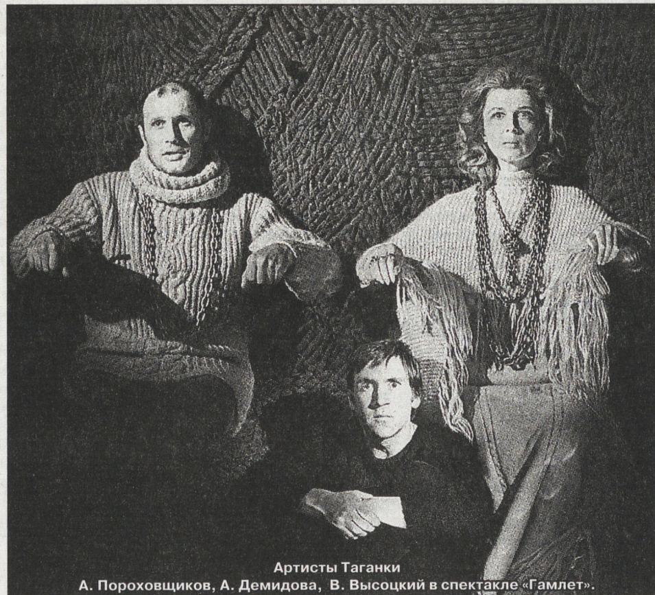
Артисты Таганки А. Пороховщиков, А. Демидова, В. Высоцкий в спектакле «Гамлет».

— Поразительной силы и мощи. Подавляющее большинство людей в СССР не могли попасть на Таганку, где его любили, где для Юрия Любимова он был артистом номер один. А мы его практически не знали в этом качестве. И в кино роли было немного: «Место встречи...» появилось незадолго до смерти, «Интервенция» Геннадия Полоки лежала на полке. Но сами песни показывали его актёрство. Каждая — спектакль, сыгранная гениально, точнее — прожитая — роль. Театр, к сожалению, смертное искусство. Остались лишь маленькие фрагменты его театральных работ, но даже они дают представление об уникальности и масштабе его сценического таланта. Театр на Таганке, собственно, и начался со спектакля «Добрый человек из Сезуана», где он играл главного героя. А его Лопухин