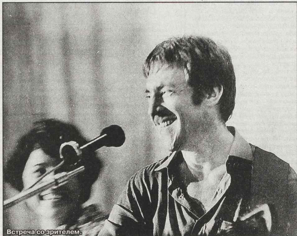
Встреча со зрителем.

— Я не считаю, что при всей своей гениальности он был каким-то исключением, «выпал из гнезда»... Люди, которые вместе с ним творили, вписываются, хоть и драматично, в современность. Не так гремит Лю-