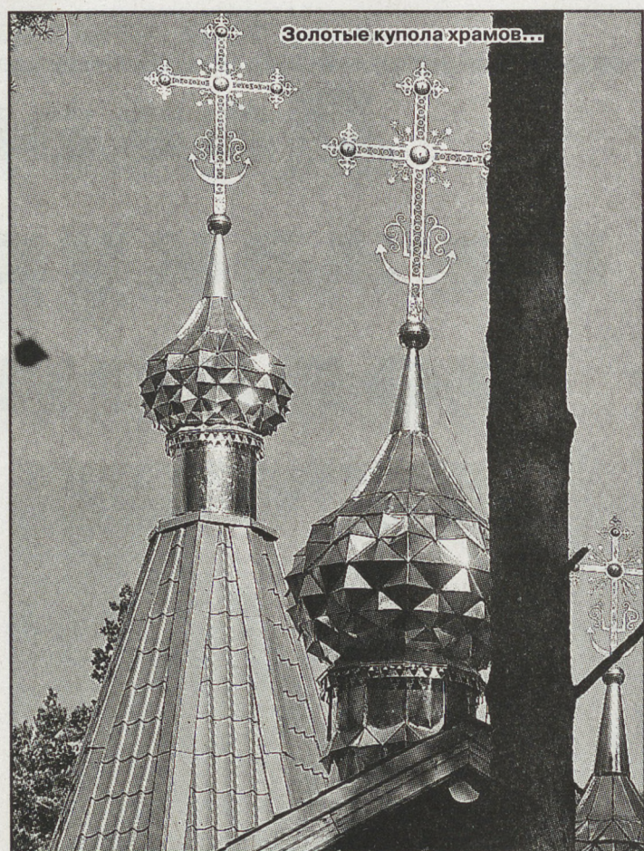
Золотые купола храмов...

упускают возможности поговорить с батюшками, прикоснуться к привезённым со всей России святыням. Огромная молчаливая очередь к Поклонному кресту. Кресту прикасаются руками и лбами, прикладывают иконы и фотографии, испрашивают прощения. Останавливаются, обращая именные лица и молитвы к покрытой шёлком траве Яме, где несколько берёз – единственные оставшиеся в живых свидетели трагедии.