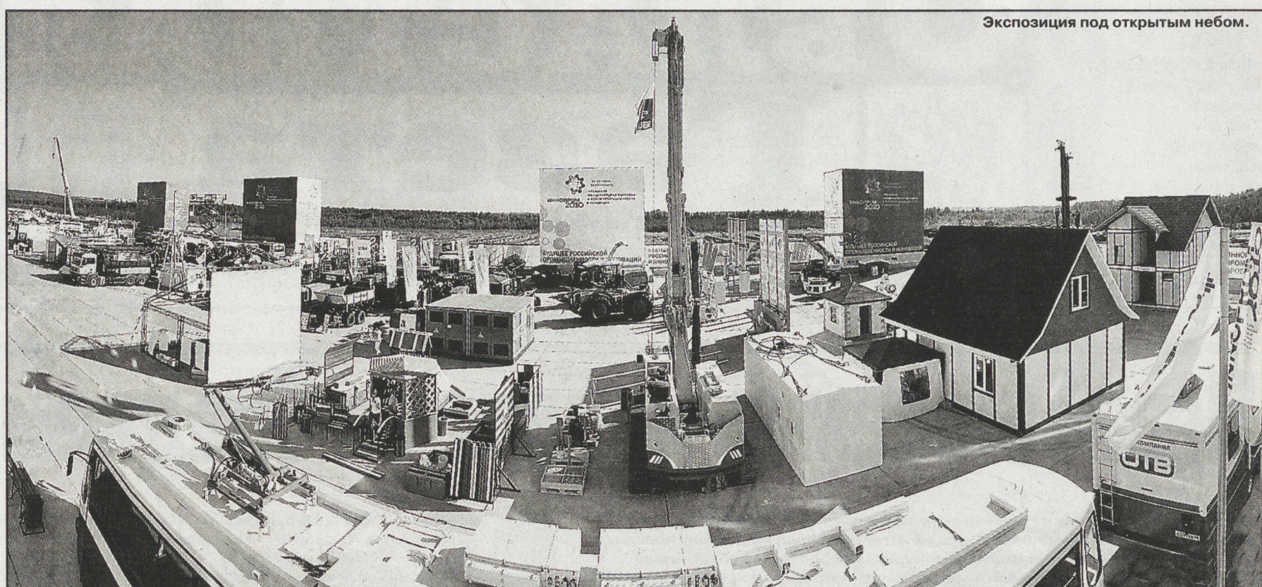
Экспозиция под открытым небом.