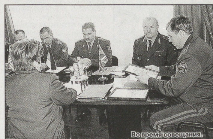
Во время совещания.

Одним из наиболее громких примеров международного партнёрства стала история с хищением картин и предметов искусства в столице Среднего Урала. В период 2000–2002 годов гражданин Дик В.А., входя в доверие к гражданам, представлялся им владельцем художественной галереи в Германии и под этим предлогом выманивал у них картины, после чего незаконно вывозил их в ФРГ. Ущерб от действий мошенника составил 117 тысяч долларов США. Тогда было возбуждено 18 уголовных дел. Вора задержали в 2004 году в Екатеринбурге сотрудники фи-