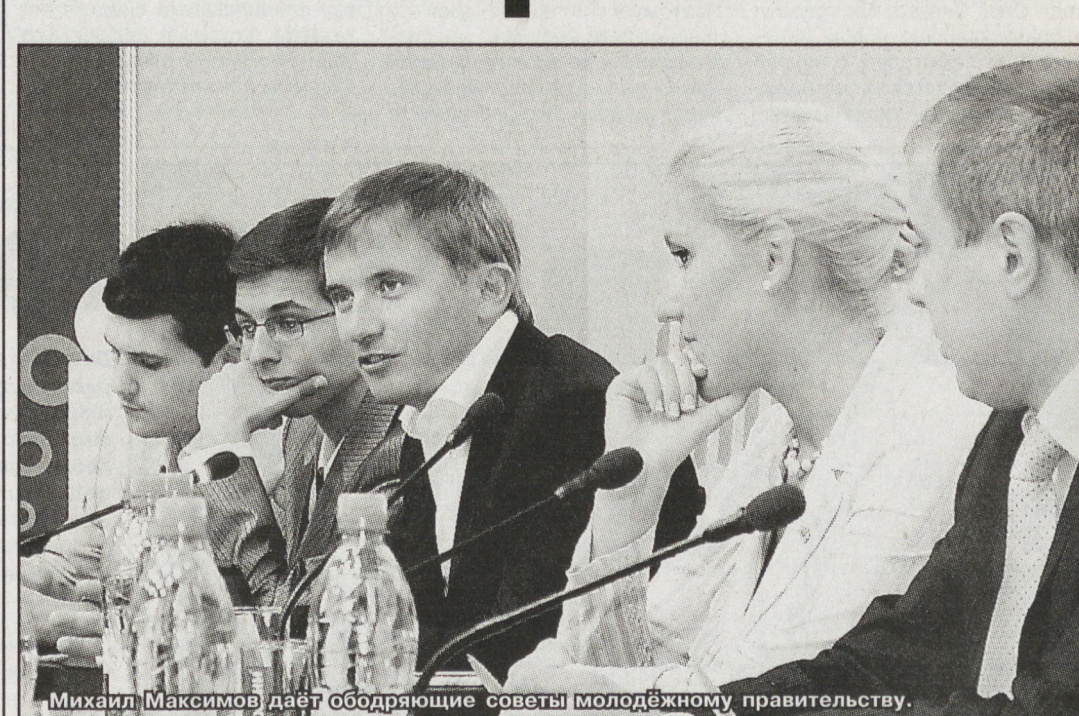
Последний день работы Уральской международной выставки и форума промышленности и инноваций «Иннопром-2010» стал не только детским днём, но и молодёжным: в одном из конференц-залов состоялось открытие интерактивного заседания молодёжного правительства Свердловской области, где после бурного обсуждения были приняты решения по трём инновационным проектам.