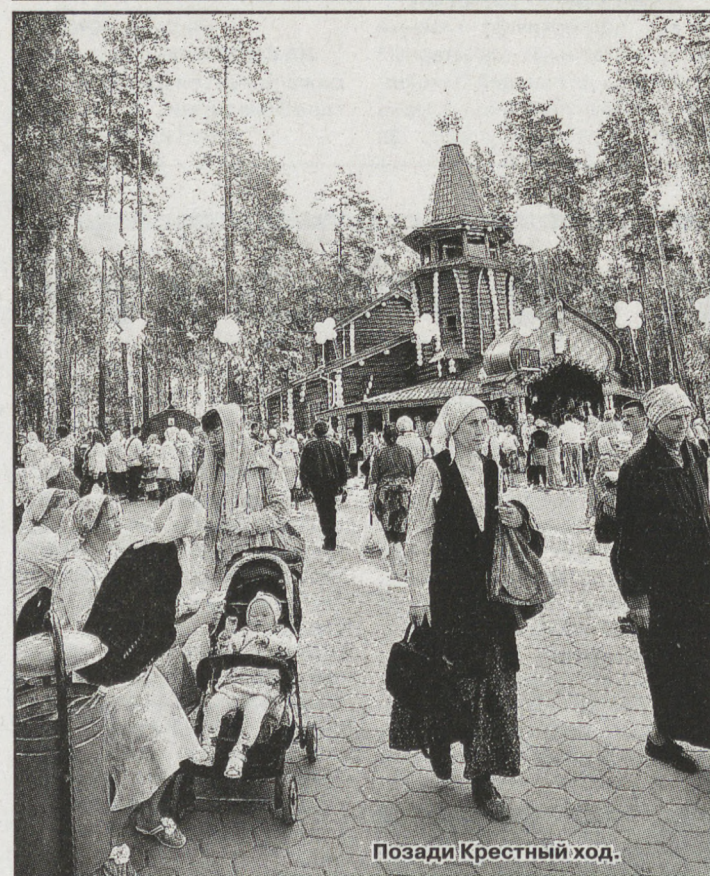
Позади Крестный ход.