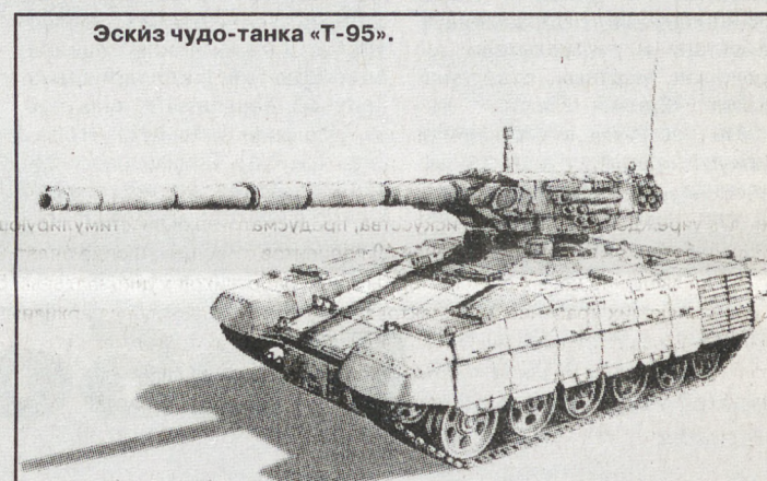
Эскиз чудо-танка «Т-95».

Таким образом, «неопознанный стреляющий объект» Уралвагонзавода сегод-