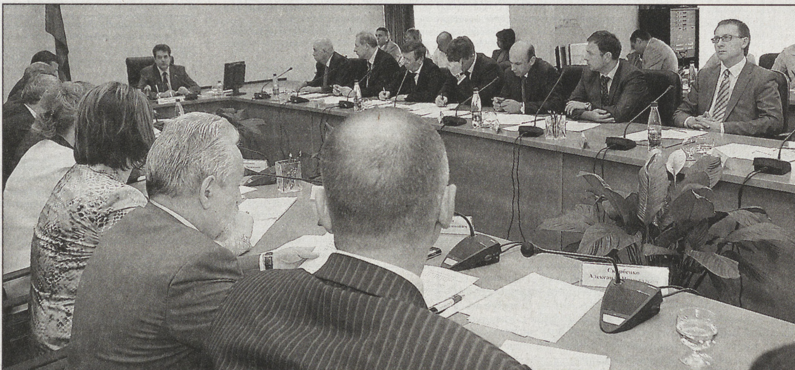
Во время заседания Совета.

Далее заместитель Генерального прокурора России привёл конкретные примеры и цифры. Есть случаи разбазаривания бюджетных и других средств, присвоения государственного имущества... В 2005 году на территории УрФО были