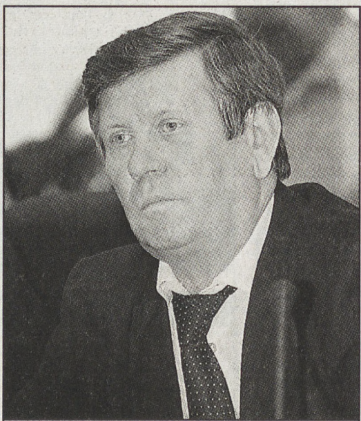
В. Кучеров: «Общество должно противостоять взяточникам. Без участия СМИ здесь не обойтись».

— Сила печатного слова велика, — сказал заместитель Генерального прокурора. — Гласность бьёт по преступникам. Они боятся её. Но иногда в отдельных СМИ появляются заказные публика-