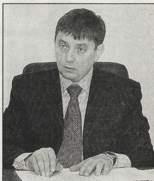
академика С. Вонсовского. В столице Урала соберётся весь цвет академической и вузовской науки.

Это рабочие моменты, но впереди у УрГУ и УГТУ-УПИ большой юбилей – 90-летие. Подготовка к этому событию уже началась. В программе празднования юбилея предусмотрены и общие мероприятия, и ряд мероприятий по вузам. Большим событием станет конференция Ассоциации ведущих вузов России. Ассоциация образована 1 июня этого года, в неё вошли федеральные университеты, национальные исследовательские университеты и два университета с особым статусом – МГУ и СПбГУ. Конференция пройдёт в Екатеринбург 14–15 октября в рамках 90-летия вузов и 100-летия со дня рождения