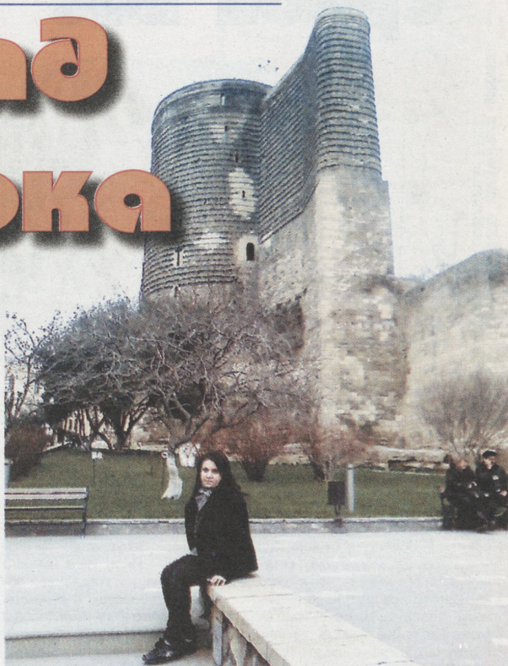
Автор на фоне Девичьей башни.