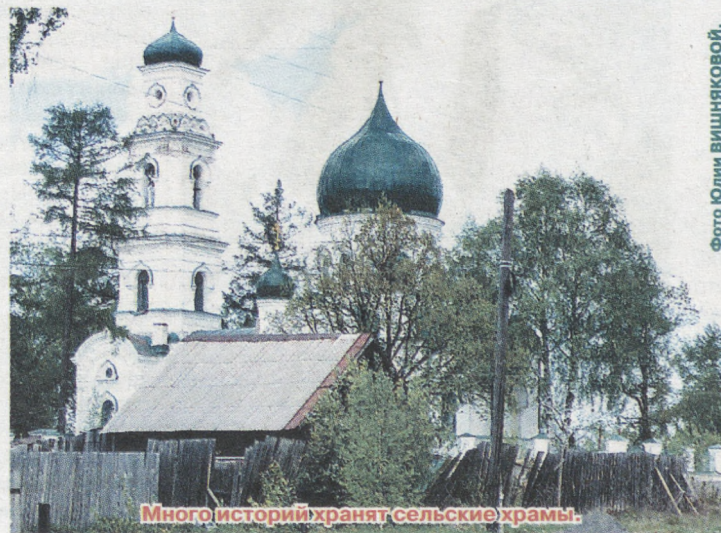
Многоисторий хранят сельские храмы.

...На подъезде к храму, между верхушек деревьев замелькала колокольня, а потом начал просматриваться и сам храм. Он напоминает лебедя, вот-вот собирающегося начать свой полёт. Внутри понимаешь, насколько великолепен акустика этого строения: не успеваешь произнести слово, а оно уже облетает храм тысячу отзвуков, доходит до купола и возвращается обратно.