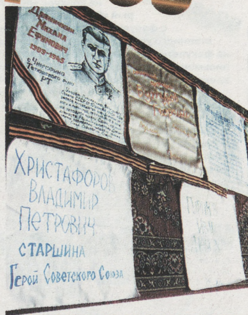
Фрагмент ленты «солдатских платков».