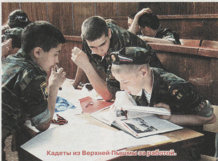
Кадеты из Верхней Пышмы за работой.

Люди, про которых ребята делали «солдатские платки», — не всегда Герои Советского Союза, у них разный боевой путь, но все они двигались к Победе одними дорогами, не зная об этом. Ребята говорят: кто пошёл на войну, тот уже герой. Имена этих героев запечатлены на «солдатских платках». Платки шиты в одну большую ленту.