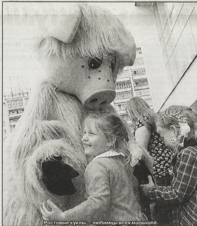
Ростовые куклы — любимцы всех малышей.