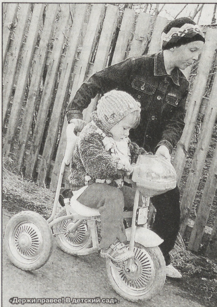
«Держи правее!» В детский сад.