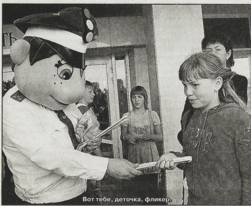
Вот тебе, деточка, фликер.