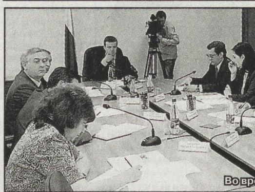
Во время заседания.