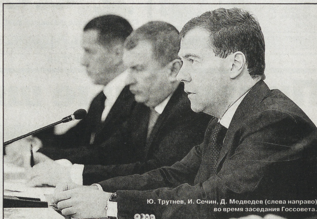
Ю. Трутнев, И. Сечин, Д. Медведев (слева направо) во время заседания Госсовета.

Этот муниципалитет нельзя назвать моногородом, но там эти предприятия – одни из крупнейших налогоплательщиков, надёжные и ответственные работодатели. Первые два относятся к отрасли