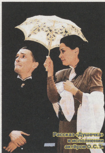
Рассказ «Душечка» в исполнении актёров О.С.Т.