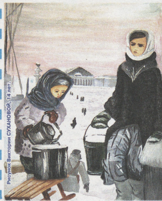
Рисунок Виктории СУХАНОВОЙ, 14 лет, г. Новоуральск