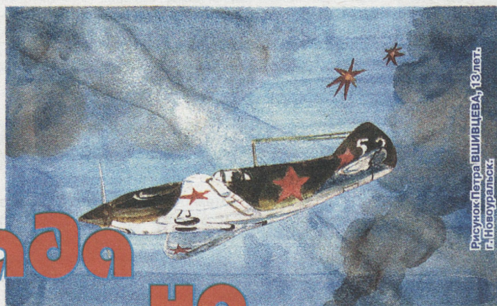
Рисунок Петра ВИШНЯЦЕВА, 13 лет, г. Новоуральск

Дедушка рассказывал, как из своего окна видел воздушный бой над Ленинградом. Окна в квартире заклеивали крест-накрест бумажными полосками, чтобы от воздушной волны при взрывах стёкла не лопались. В