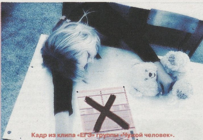
Кадр из клипа «ЕГЭ» группы «Чужой человек».

Своими впечатлениями от ЕГЭ с читателями «НЭ» делятся выпускники прошлых лет. Улыбаемся и учимся на чужих ошибках.