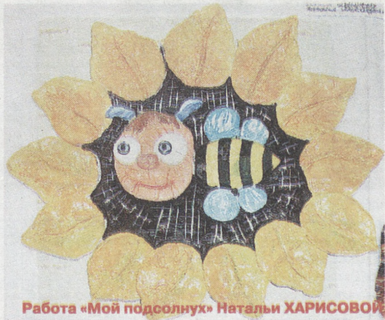
Работа «Мой подсолнух» Натальи ХАРИСОВОЙ.