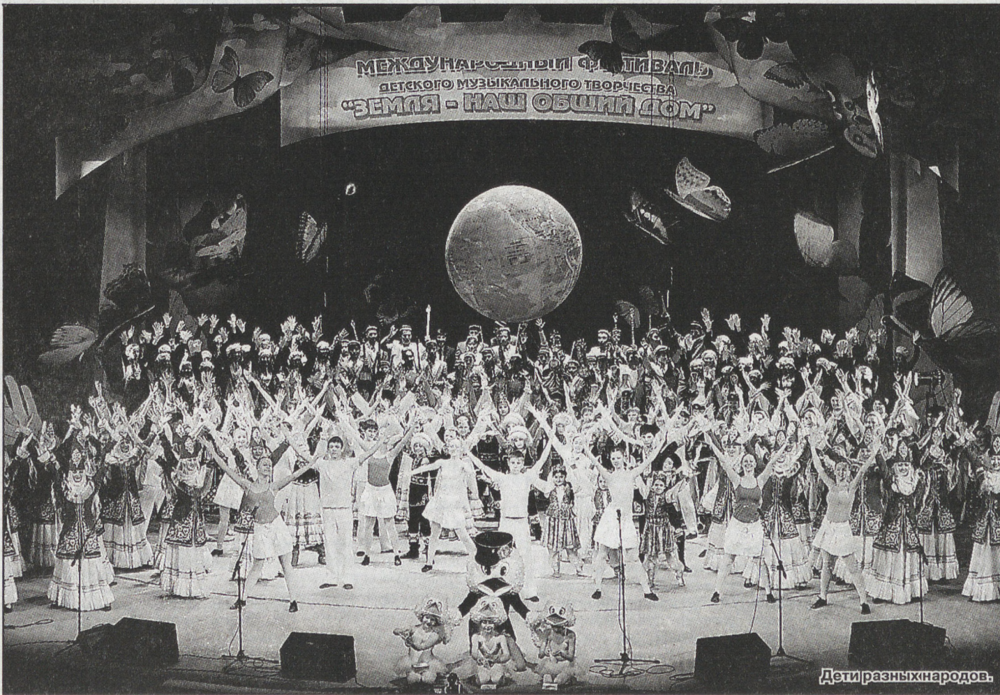
Дети разных народов.

Ирина АРТАМОНОВА. Ирина ВОЛЬХИНА. Наталья ПОДКОРЫТОВА.