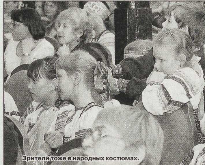
Зрители тоже в народных костюмах.