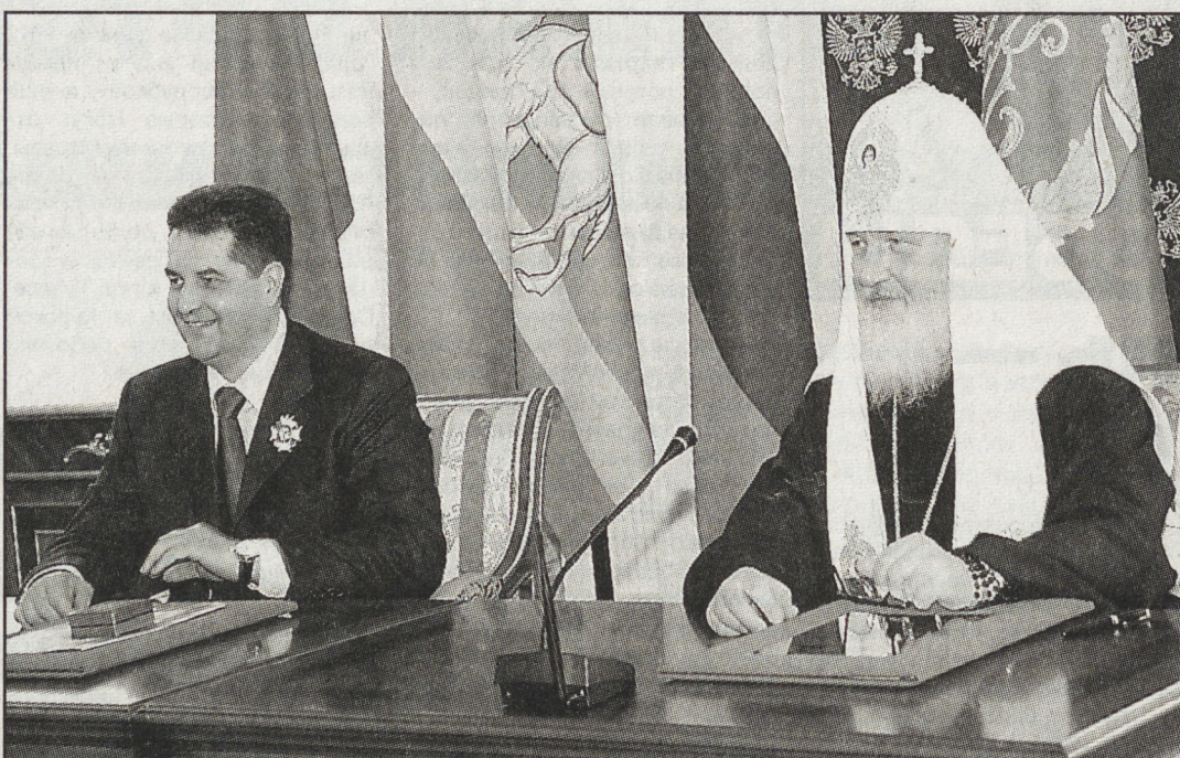
Фото Станислава САВИНА.

Департамент информационной политики губернатора Свердловской области. НА СНИМКАХ: соглашение подписывают Святейший Патриарх Московский и всея Руси Кирилл и полномочный представитель Президента РФ в Уральском федеральном округе Н. Винниченко; участники торжественного подписания соглашения.