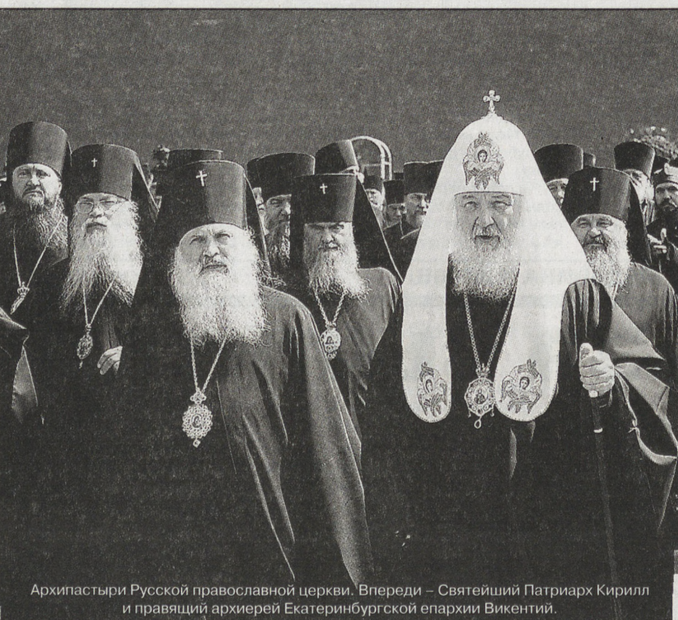
Архипастыри Русской православной церкви. Впереди — Святейший Патриарх Кирилл и правящий архиерей Екатеринбургской епархии Викентий.