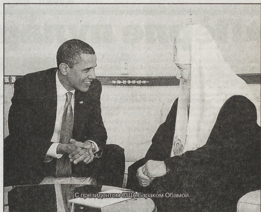
С президентом США Барак Обамой.

Сердечное спасибо всем, кто познакомил наших читателей с высоким церковным гостем. Более полная картина предстанет перед теми, кто посетит фотовыставку в Храме-на-Крови.