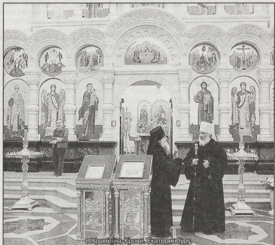
В Храме-на-Крови, Екатеринбург.