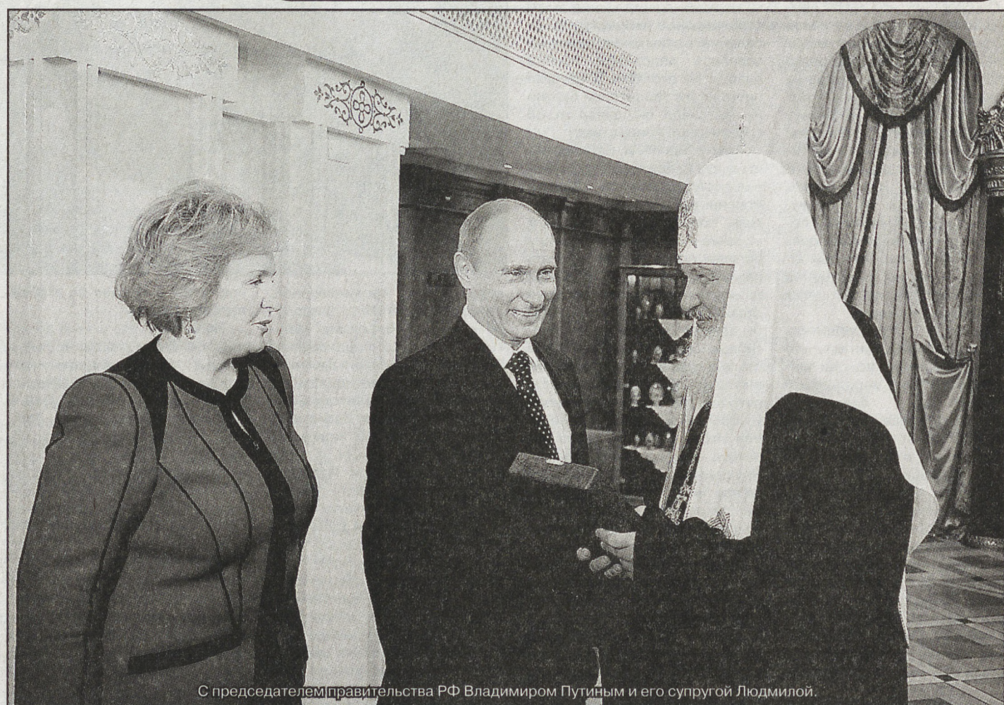
С председателем правительства РФ Владимиром Путиным и его супругой Людмилой.