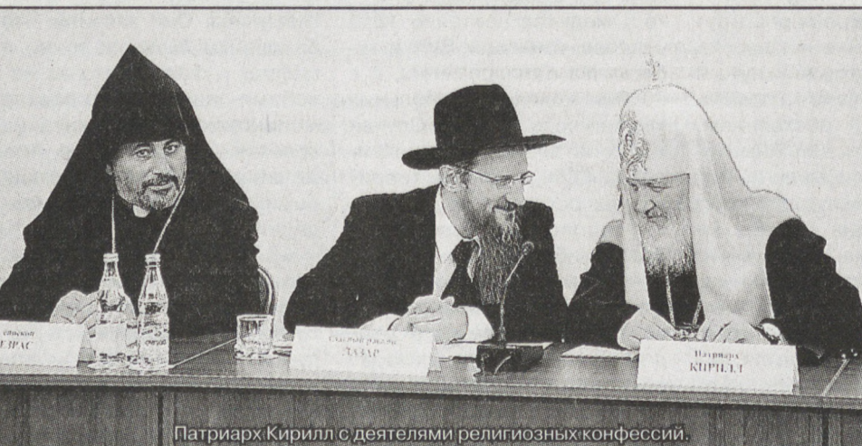
Патриарх Кирилл с деятелями религиозных конфессий.