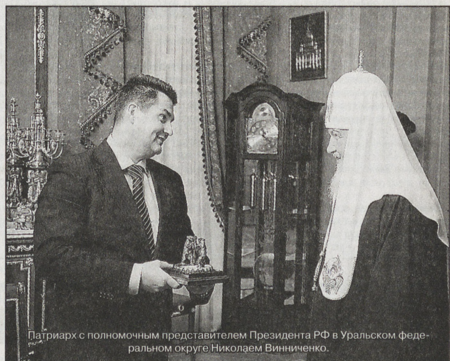
Патриарх с полномочным представителем Президента РФ в Уральском федеральном округе Николаем Винниченко.