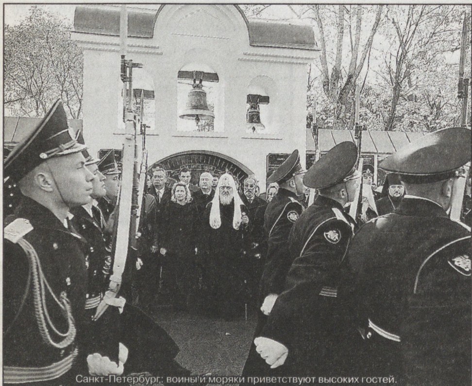
Санкт-Петербург: воины и моряки приветствуют высоких гостей.