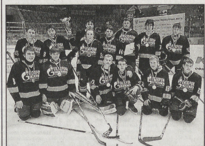
НА СНИМКЕ: хоккеисты «Искорки» — победители турнира.

Матчи проводили дворовые команды, так что уровень игры любительский, и отметил Пётр Созонов. Но я считаю, если поддержать этих ребят сегодня, то завтра из них вполне могут вырасти будущие олимпийцы.