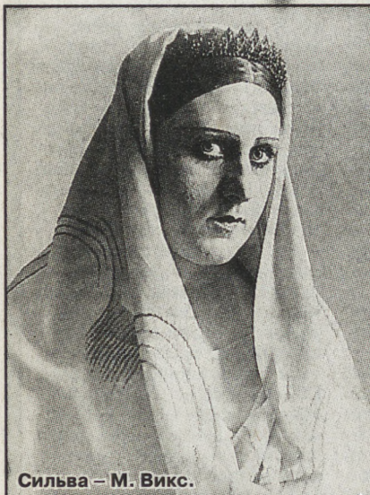
Сильва — М. Виск.

именно этот период. Четыре года войны, которые здесь, в тылу, были её служением Победе.