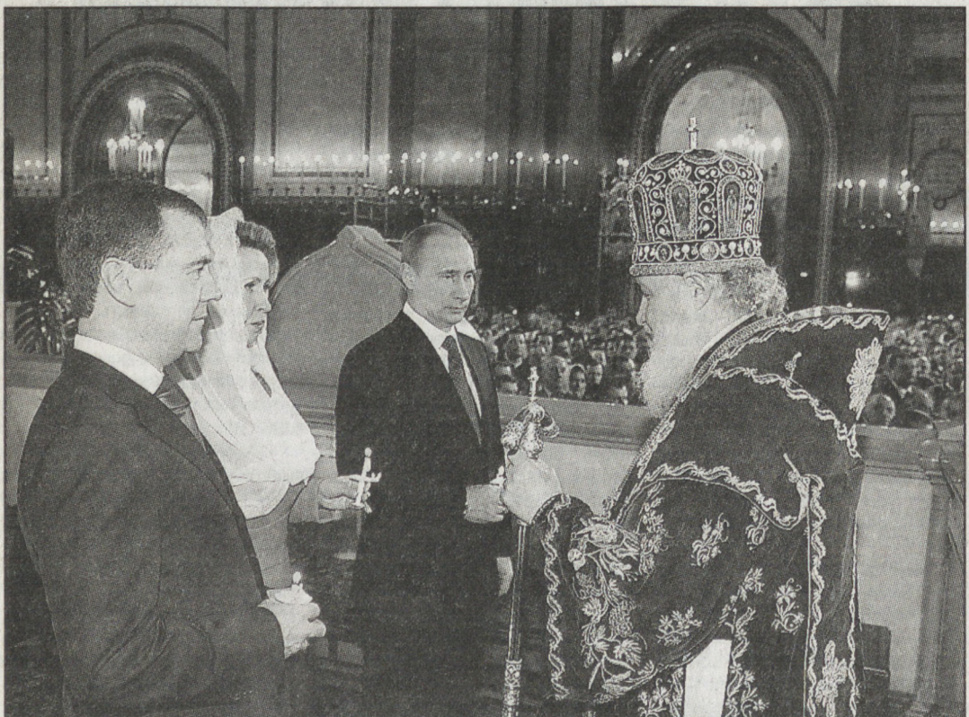
МОСКВА. 4 апреля. Президент России Дмитрий Медведев с супругой Светланой, премьер-министр РФ Владимир Путин и Патриарх Московский и Всея Руси Кирилл (слева направо) на праздничном пасхальном богослужении в Храме Христа Спасителя.