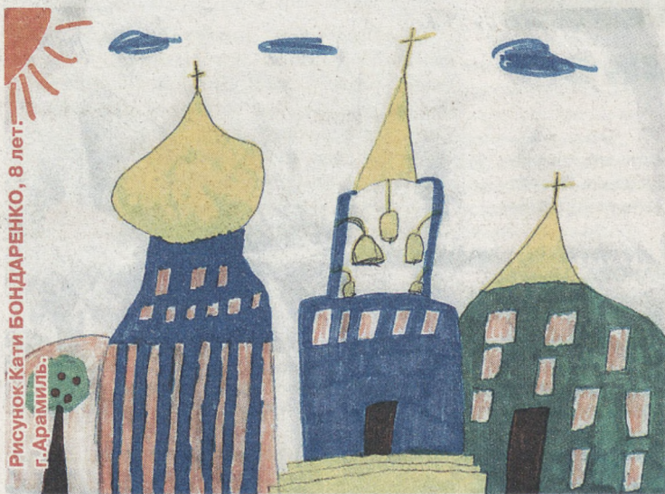
Рисунок Кати БОНДАРЕНКО, 8 лет, г. Арамиль.