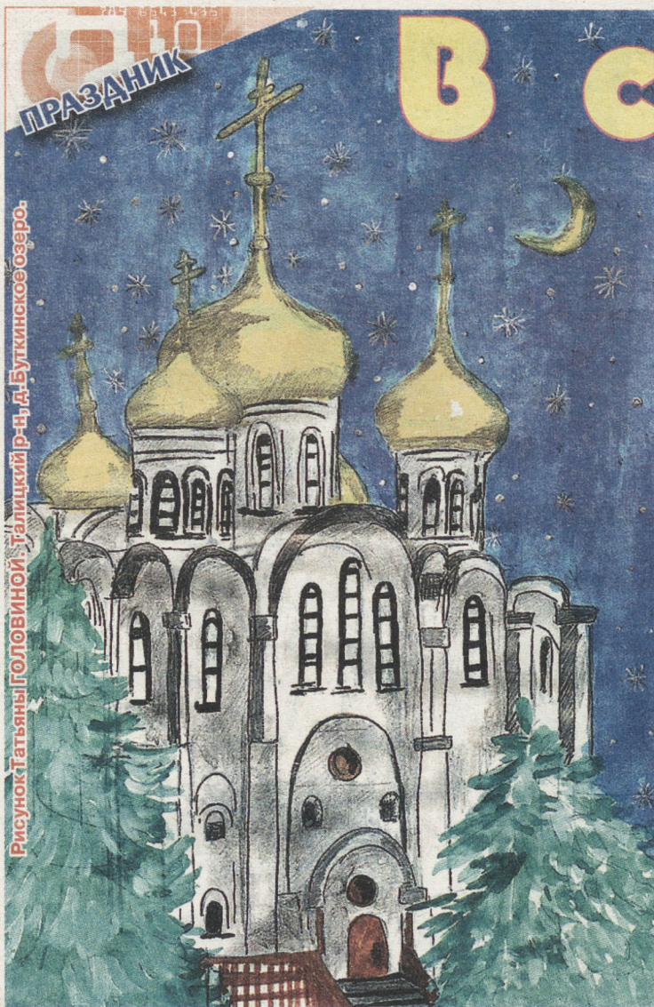
Рисунок Татьяны ГОЛОВИНОЙ, 14 лет, г. Буткино, оз. Буткино.