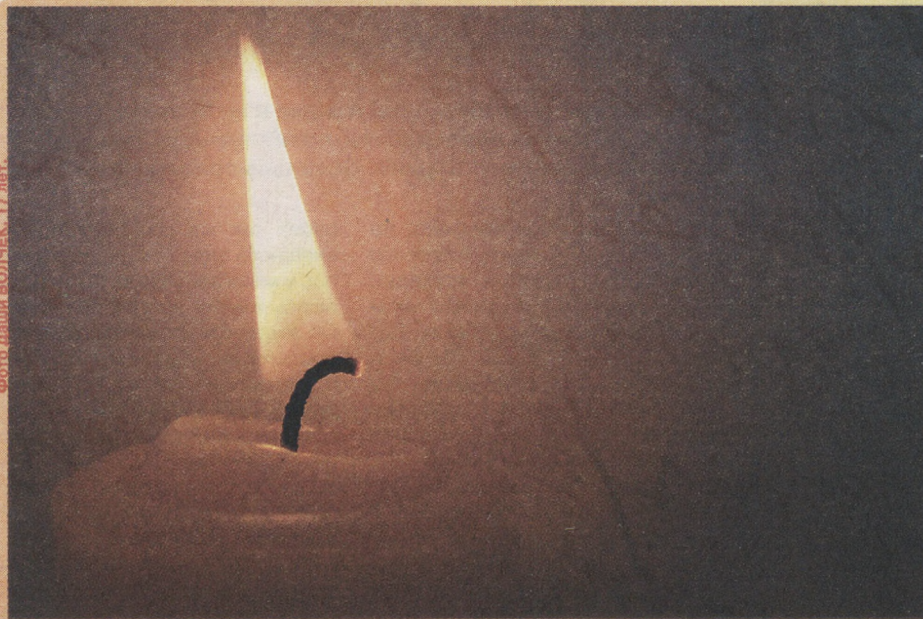
Фото Дании Волчек, 17 лет.

Я увлекаюсь вязанием на спицах и крючком. Очень люблю гулять, кататься на коньках и лыжах.