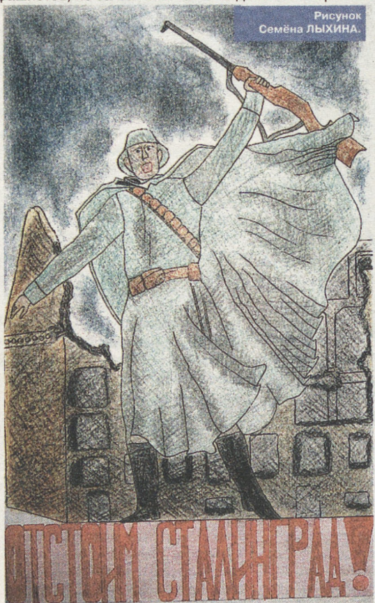
Рисунок Семёна ЛЫХИНА.