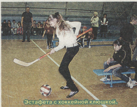
Эстафета с хоккейной клюшкой.

В этот раз на старт вышли команды из пяти городских школ и Невьянского детского дома. Все ребята были настроены решительно, что и показали в спортивной эстафете: мальчишки умело прыгали со скакалкой, а девочки виртуозно владели хоккейной клюшкой.