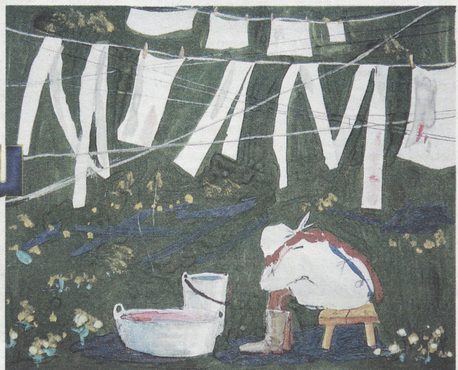
Рисунок Олеси КРАСНИКОВОЙ, 13 лет. г. Нижний Тагил.