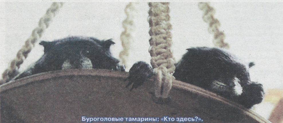
Буроголовые тамарины: «Кто здесь?».