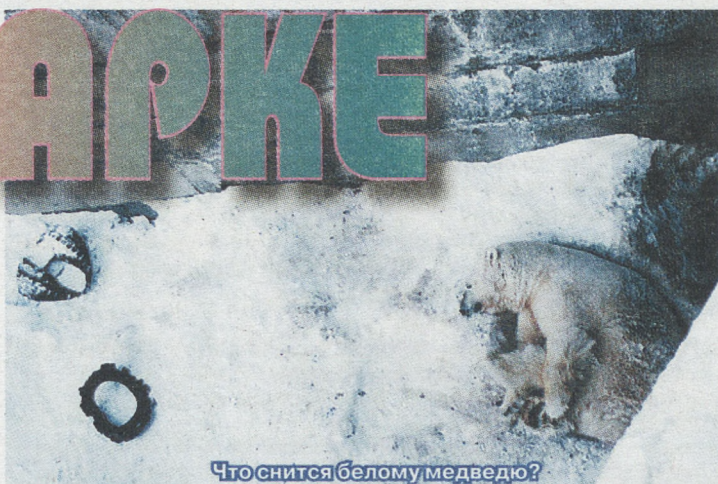
Что снится белому медведю?