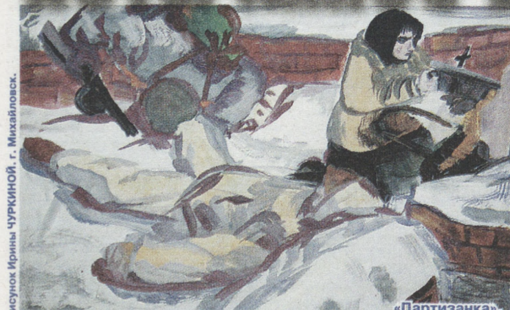
Рисунок Марии ЧУРКИНОЙ, г. Михайловск.

силы, чтоб, несмотря на напор жесточайших обстоятельств, постоянную угрозу пыток и смерти, не поддаться звериному закону, не потерять в себе человека, не отказаться от всего, что с детства стало святым. И мы, нынешнее поколение детей, гордимся этими патриотами, которые сохранили честь и достоинство советских людей, боролись и умирали с гордой верой в Родину, в свой народ, в победу.