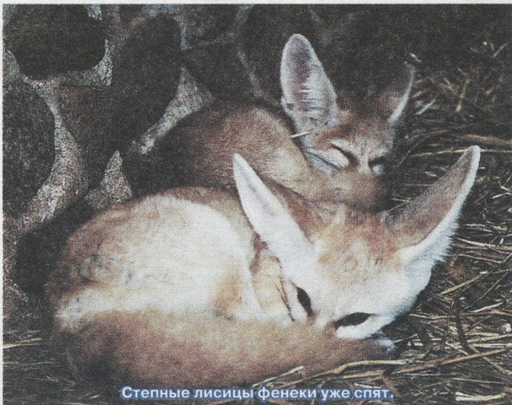
Степные лисицы фенёки уже спят.