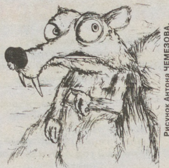
Рисунок Антона ЧЕМЕСОВА.

В новой серии наши доисторические друзья Мэни, Сид и Диего спасаются из долины, которой грозит потоп, по пути они встречают двух братьев-опоссумов Эдди и Крэша и мамонтиху Элли, считающую себя родной сестрой Эдди и Крэша и, следовательно, тоже опоссумом, просто более крупным, чем остальные представители этого вида. Эта веселая компания путешествует через долину, попадая в разные переделки и выясняя, кем же, все-таки, является Элли. Советую всем людям, любящим юмор и анимацию, посмотреть "Ледниковый период-2", насладиться хором грифов и узнать, как выглядит рай для саблезубой белки. Она продолжает радовать нас своими похождениями и во второй части.