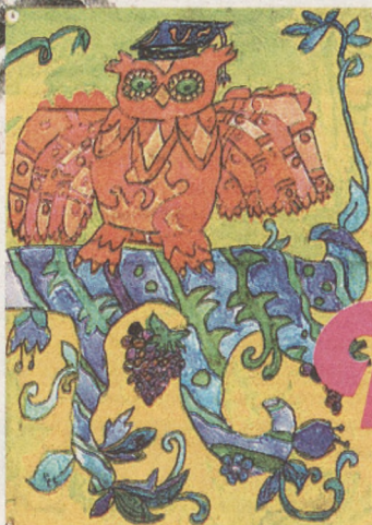
Сова, гуашь. 7 лет.

Не люблю рисовать портреты. Потому что если получится плохо, люди могут обидеться. Поэтому рисую натюрморты и фантазии. Только иногда пишу пейзажи, потому что не всегда есть возможность надолго выехать на