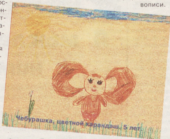
Чебурашка, цветной карандаш. 5 лет.

Сейчас учусь в художественном училище, но для себя рисую редко. Так как на занятиях мне хватает и композиции, и графики, и живописи.