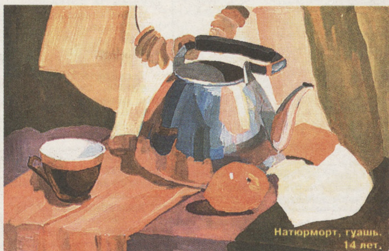
Натюрморт, гуашь. 14 лет.