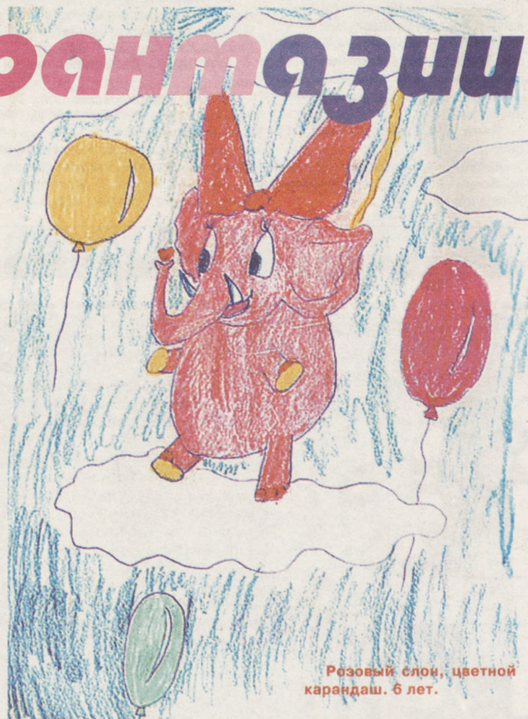
Розовый слон, цветной карандаш. 6 лет.