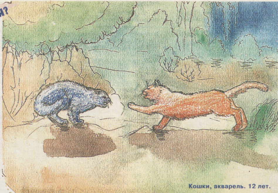
Кошки, акварель. 12 лет.