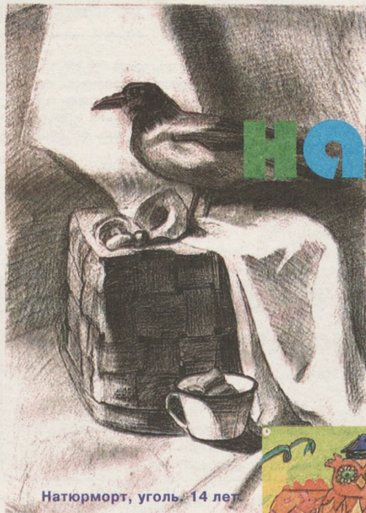
Натюрморт, уголь. 14 лет.

Сколько себя помню, я всегда рисовала. Рисовала дома на обоях, во дворе на асфальте, в школе на партах и на полях тетрадей. Когда я кого-то слушаю — рисую, когда думаю — я рисую.