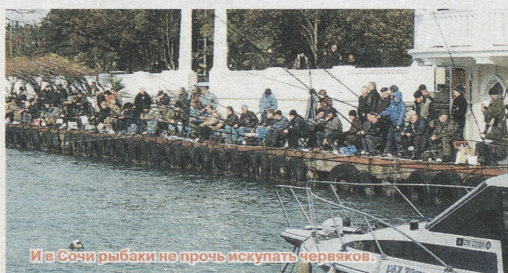
И в Сочи рыбаки не прочь искупать червячков.

пиада в канадском Ванкувере. Конечно, пока наш Сочи мало напоминает будущую столицу Олимпиады. Но я рада, что эти горы и это море увидят жители других стран. Потому что такую