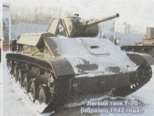
Лёгкий танк Т-70 (образец 1942 года).