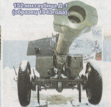
152мм гаубица Д-1 (образец 1943 года).