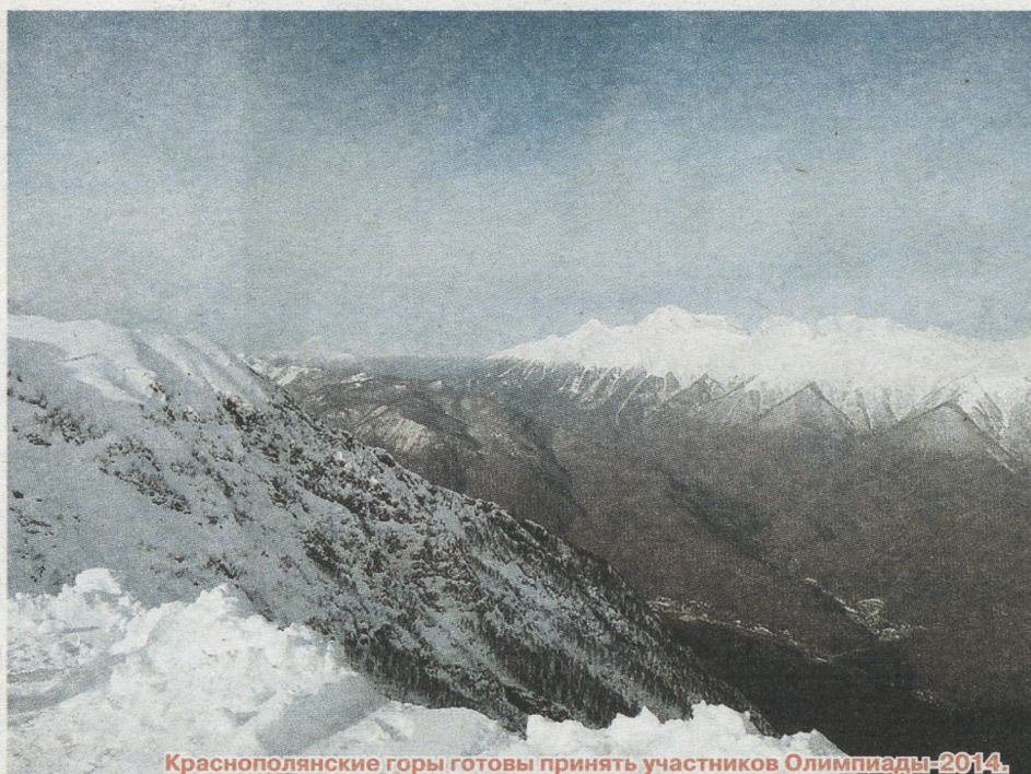
Краснополянские горы готовы принять участников Олимпиады-2014.