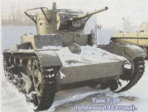
Танк Т-26 (образец 1933 года).