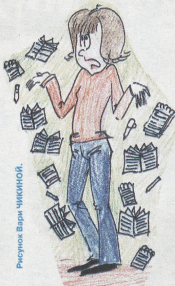
Рисунок Мари Чикиной.