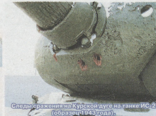
Следы сражения на Курской дуге на танке ИС-2 (образец 1943 года).