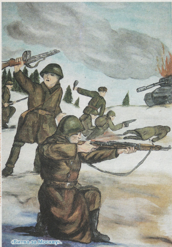
Рисунок Антонины Сыркиной, 15 лет.