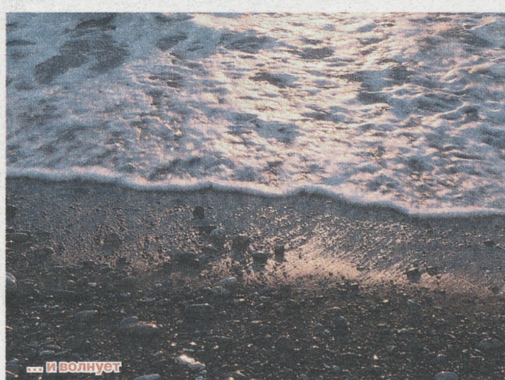
... и волнует