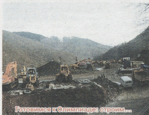
Готовимся к Олимпиаде: строим...