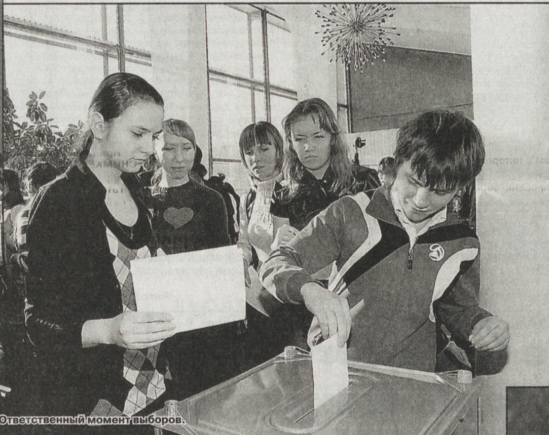
Ответственный момент выборов.

«Либерал-демократы» рассказали о своей политической программе в песне, которую исполнили красавицы в русских народных костюмах. Выступление команды, представлявшей КПРФ, вышло напористым. Та-