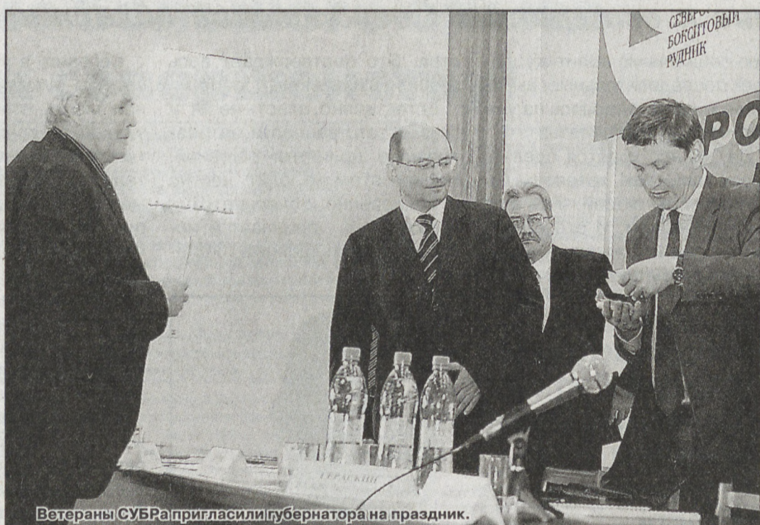
Ветераны СУБРа пригласили губернатора на праздник.