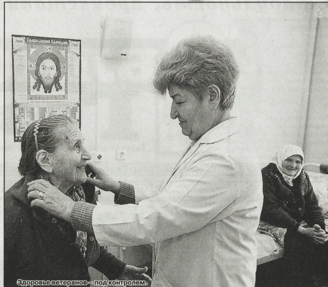
Здоровье ветеранов – под контролем.