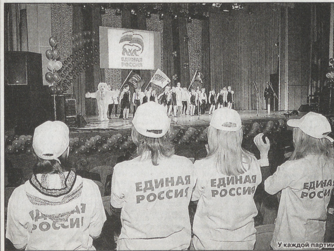
У каждой партии свои избиратели.