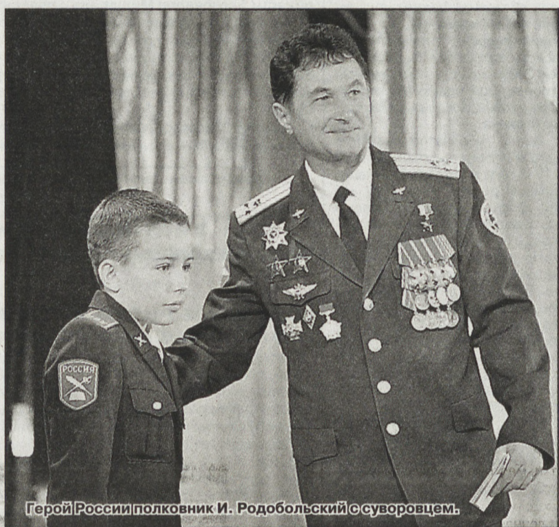
Герой России полковник И. Родобольский с сыновцем.

Февраль – время, когда в Свердловской области отмечается Месячник защитника Отечества. В эти дни, богатые событиями, проходят многочисленные встречи с воинами, ветеранами, тружениками тыла. Открываются выставки, посвященные героизму защитников Родины.