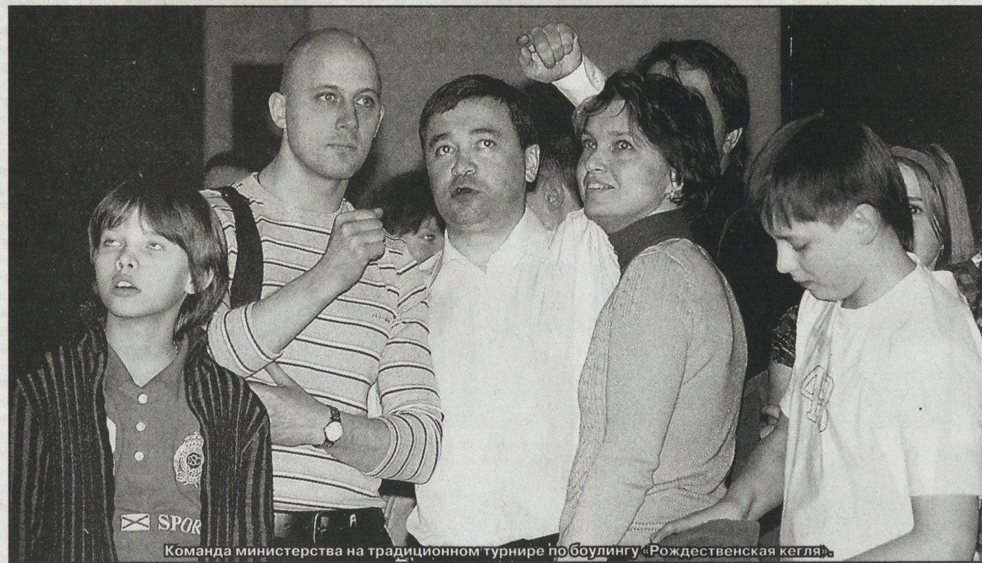
Команда министерства на традиционном турнире по бобулингу «Рождественская кегля».

В советские времена мы поставляли станки на экспорт. Сегодня предприятия предпочитают покупать немецкие, японские, итальянские, чешские. Начиная с 2007 года в списке стран, поставляющих нам машиностроительную продукцию, стал фигурировать Китай. Причём, из КНР сейчас завозим больше машиностроительной продукции, чем в своё время туда поставляли. Проанализировав эти результаты, мы пришли к мнению, что нам необходимо вести с нашими зарубежными партнёрами переговоры по поводу создания здесь сборочных производств или совместных предприятий, которые произведут и станочное оборудование, и машиностроительную продукцию. Эту работу мы стали вести планомерно и целенаправленно. Год назад мы установили контакты с потенциальными партнёрами: компаниями из Германии, Италии, Франции, Китая. Конечно, для проработки многих вопросов требуется определённое время. И наши переговоры с возможными партнёрами находятся на разной стадии. Не результаты есть. Приведу пример с компанией «Хеллер». Когда мы получили бизнес-план компании, где был расписан примерный алгоритм действий по нашим предложениям, то получилось, что «Хеллер» откроет здесь своё производство не раньше 2018 года. Постепенно после многоступенчатых переговоров, корректировки планов появилась большая надежда, что этот срок мы сократим значительно и сможем организовать совместное производство уже в бли-