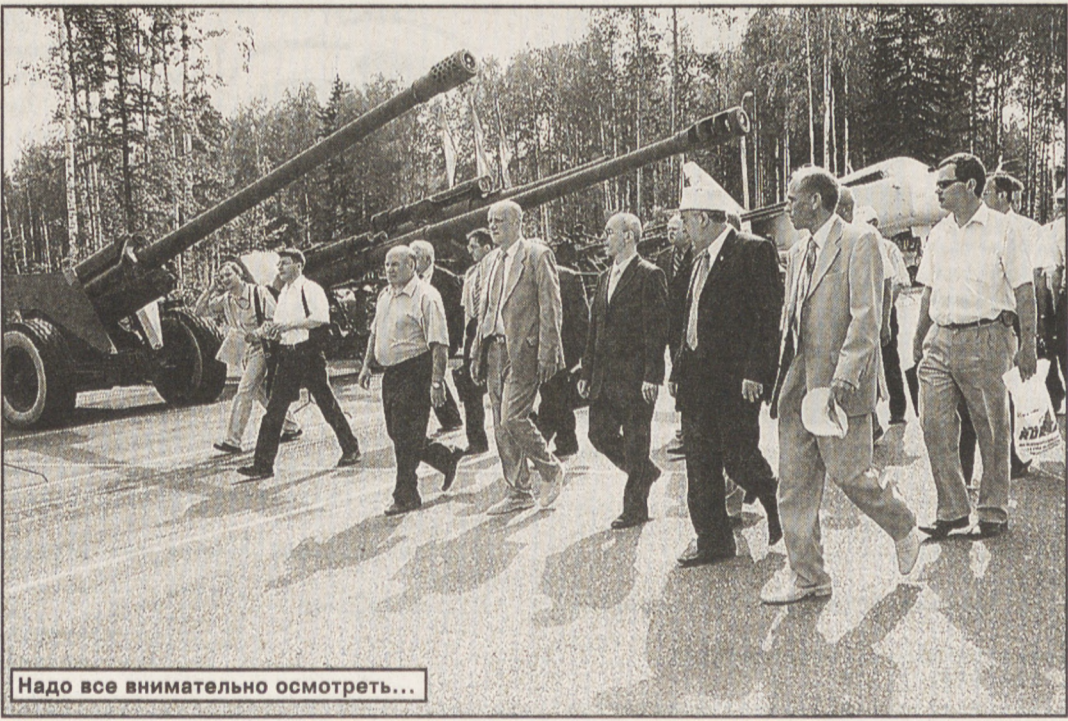
Надо все внимательно осмотреть...