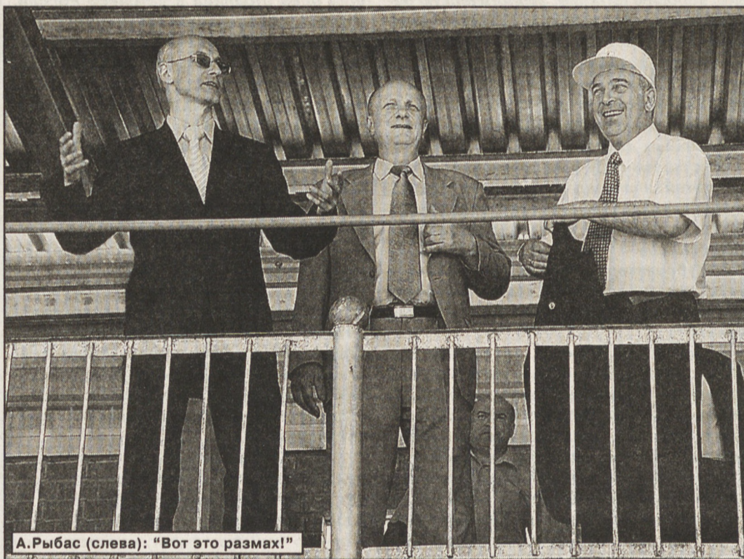
А.Рыбас (слева): "Вот это размах!"

Заместитель руководителя Федерального агентства по промышленности (Роспром) Александр Рыбас 8 июня провел в Государственном демонстрационно-выставочном центре ФКП "НТИИМ" выездное заседание Федерального организационного комитета по подготовке и проведению V Международной выставки вооружения, военной техники и боеприпасов "Российская выставка вооружения. Нижний Тагил-2006". Предваряя заседание, члены оргкомитета ознакомились с историей института, инфраструктурой выставочного комплекса, обсудили вопросы его дальнейшего развития.