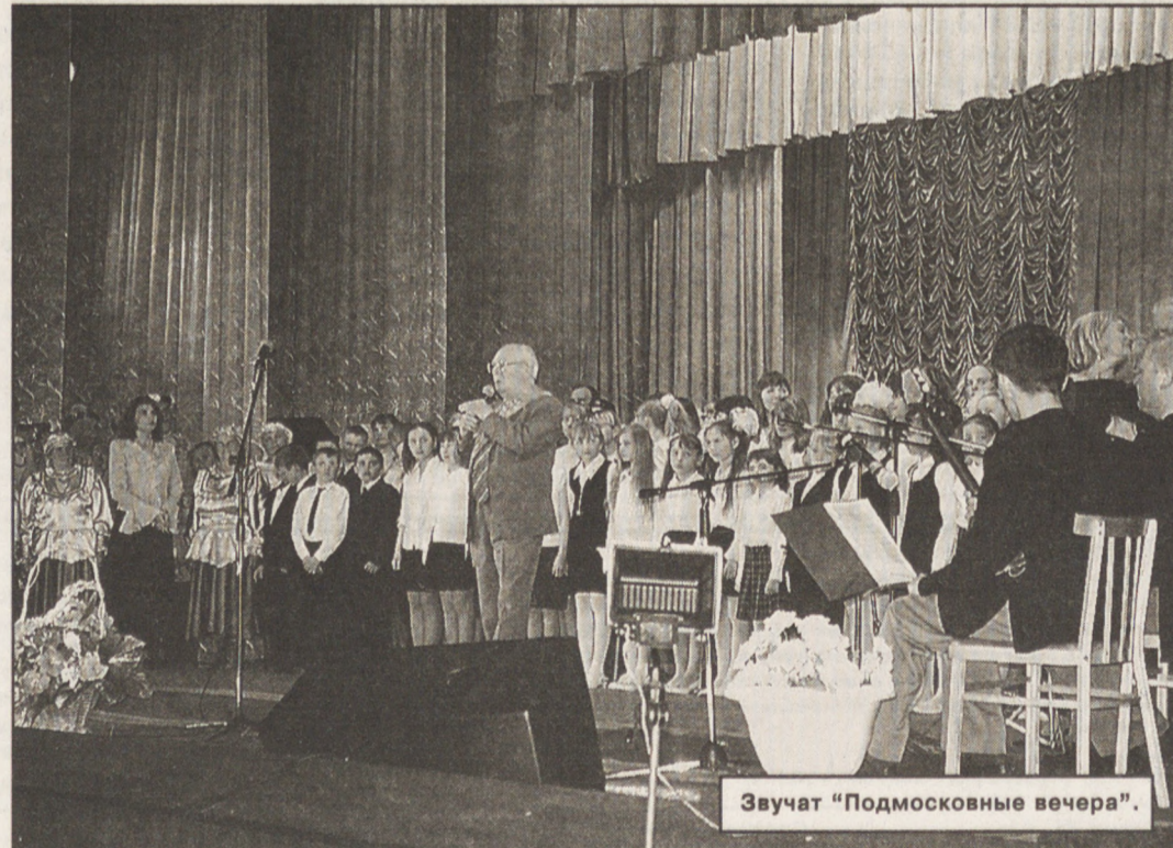
Звучат "Подмосковные вечера".