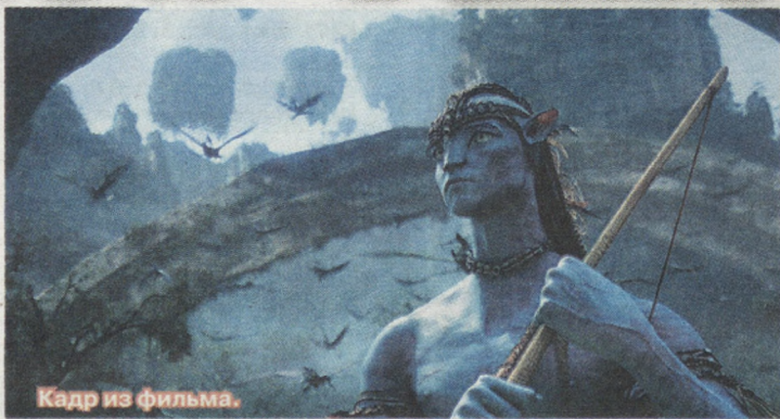
Кадр из фильма.

При ближайшем рассмотрении, особенно, если через 3D-очки, планета с роковым названием Пандора оказывается воплощением гармонии, счастливым и таким манящим, что находятся люди, которые ходили в кино на «Аватар» по