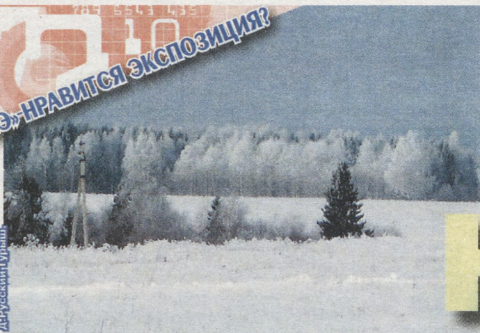
Красноуральский р-н, д. Русский Турмыш