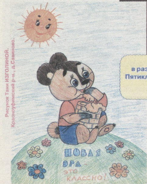
Рисунок Тани Изголиной. Красноуфимский р-н, д. Савиново.