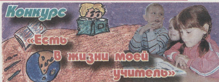
Коллаж Евгения СУВОРОВА.

Весь 9 «А» класс школы № 23. г. Волчанск.