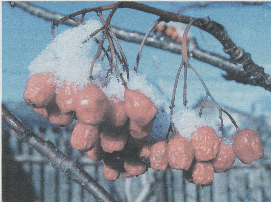
Красноуральский р-н, д. Воежино.