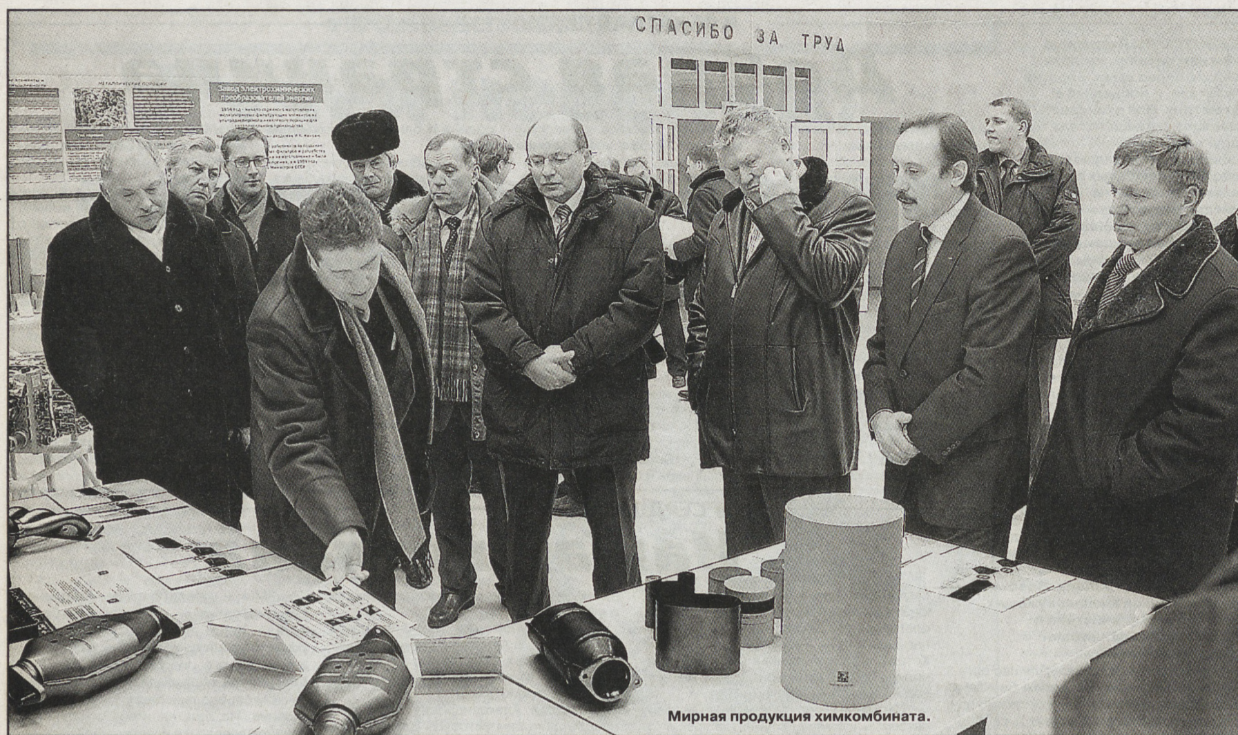
Мирная продукция химкомбината.