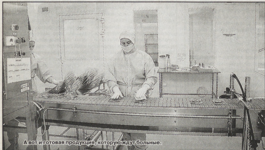
А вот и готовая продукция, которую ждут больные.