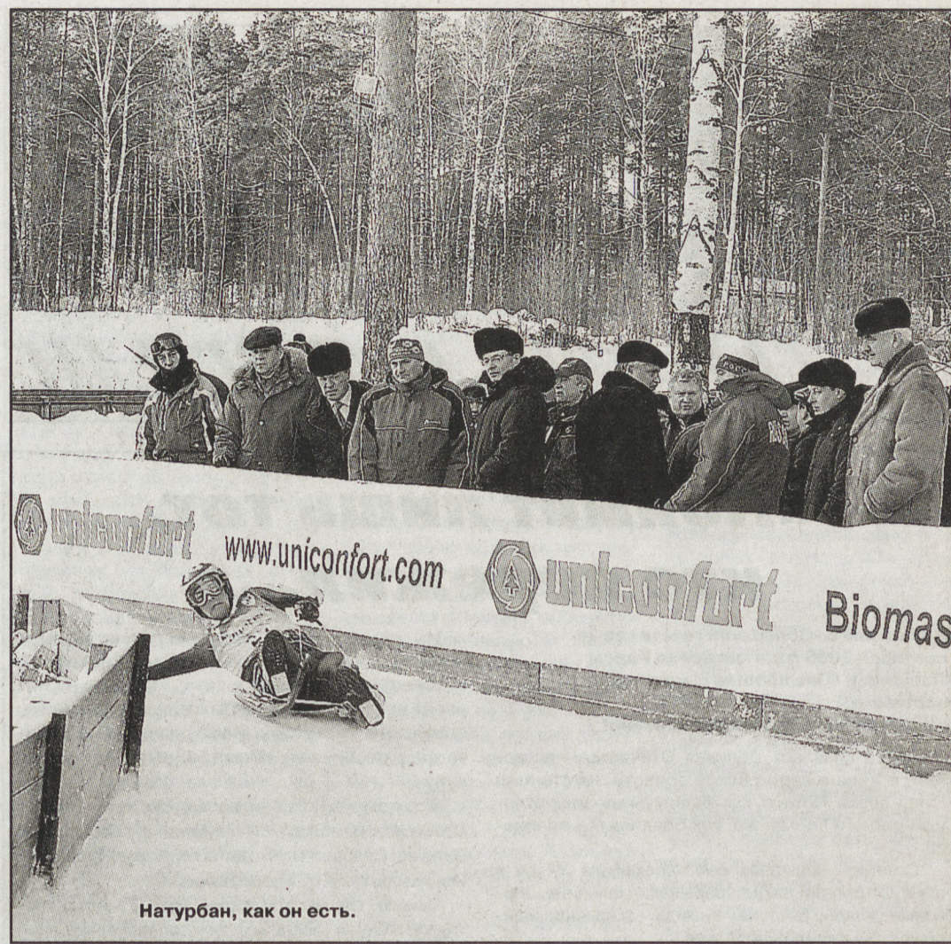
Натурбан, как он есть.

Губернатор Александр Мишарин 19 декабря совершил рабочую поездку в Новоуральский городской округ. В поездке главу области сопровождали заместитель председателя Государственной Думы РФ Валерий Язев и председатель правительства Свердловской области Анатолий Гредин.