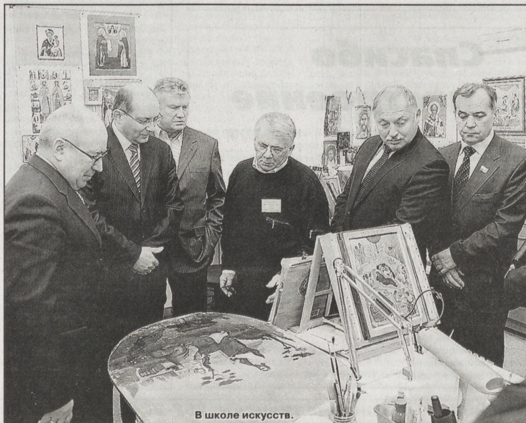
В школе искусств.