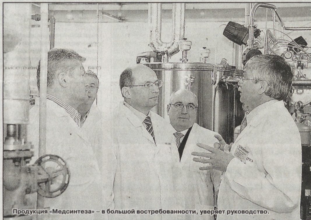
Продукция «Медсинтеза» – в большой востребованности, уверяет руководство.