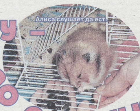
Алиса слушает да ест.