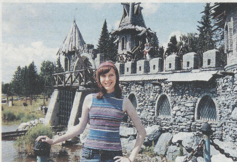
В заповеднике «Зюраткуль».

озера, утопает в зелени, а его кресты сияют золотом на солнце.