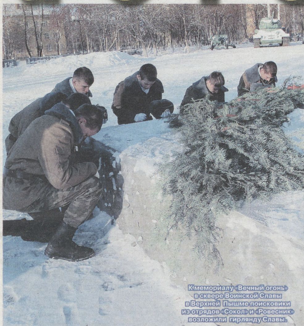
К мемориалу «Вечный огонь» в сквере Воинской Славы в Верхней Пышме поисковики из отрядов «Сокол» и «Ровесник» возложили гирлянду Славы.

Экспедиции ребят действительно интересные. Палаточный городок они разбивают на территории, где когда-то шли бои Великой Отечественной войны, и ведут раскопки. В этом году ребята были в Смоленской области. Полевая кухня, песни под гитару у костра — вот она поисковая романтика — но это не главное. В конце экспедиции они организуют торжественное перезахоронение найденных останков солдат и офицеров Красной армии со всеми воинскими почестями.