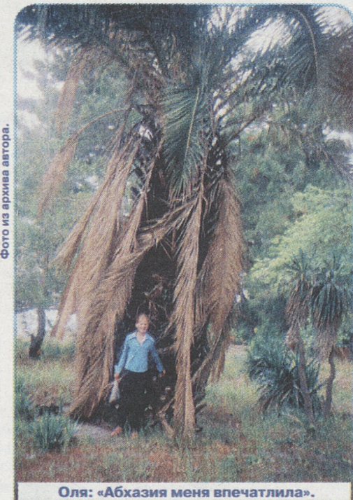
Оля: «Абхазия меня впечатлила».